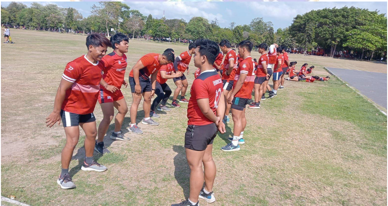
Warm Up sebelum melakukan Tes Leg Dynamometer