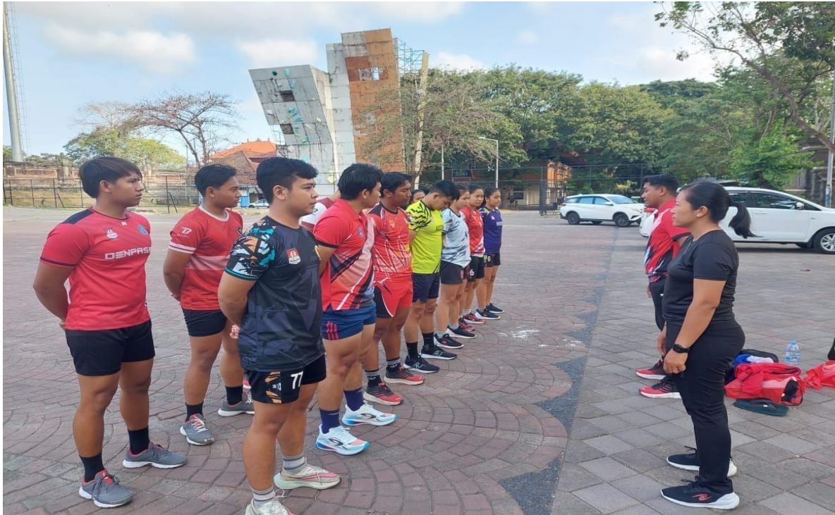
Pengarahan sebelum melakukan pengukuran