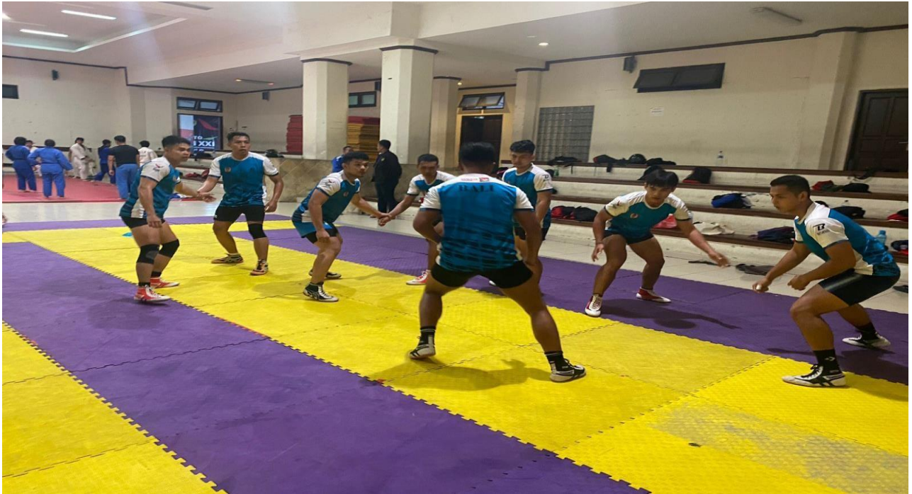
Konsep kelincahan dalam kabaddi