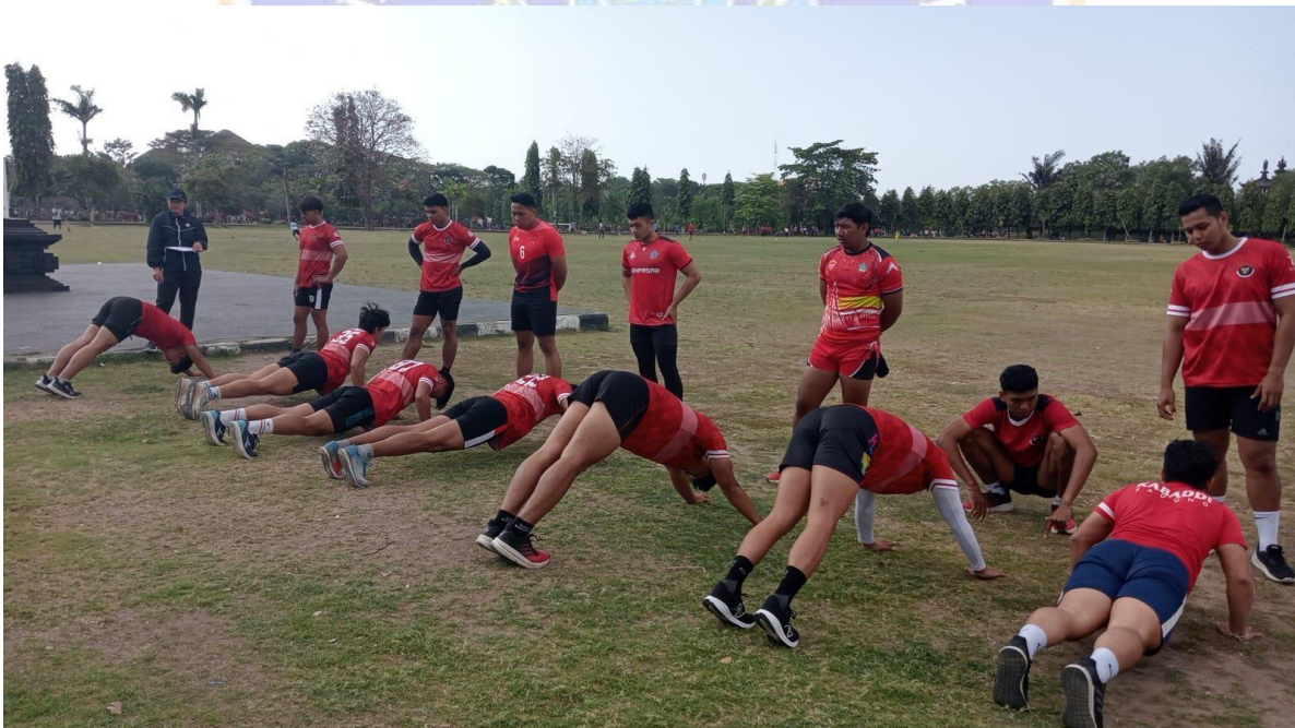
Kelenturan dalam kabaddi