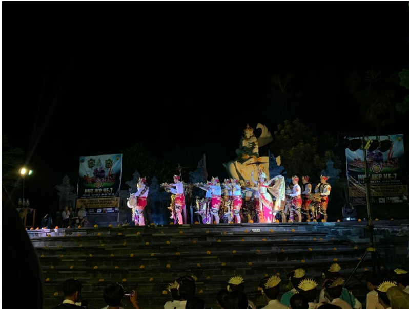
Event HUT Jelung Kumara Pemuteran