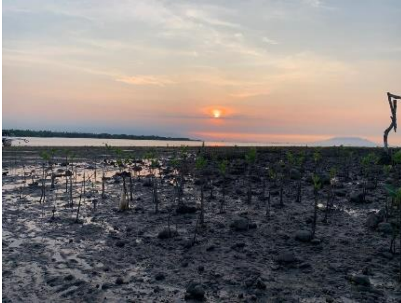
Reboisasi Mangrove di Romantic Beach Pemuteran