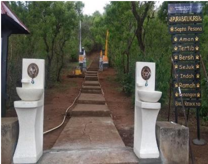
Suasana Wisata Bukit Kursi