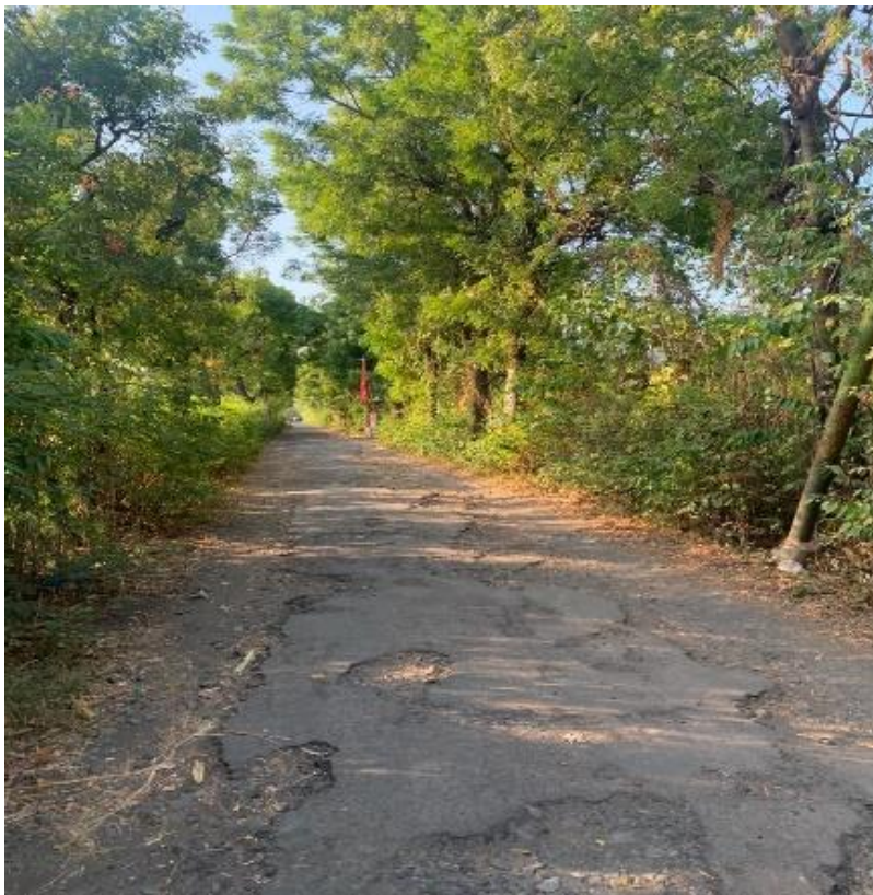
Kondisi Jalan menuju Tanjung Budaya