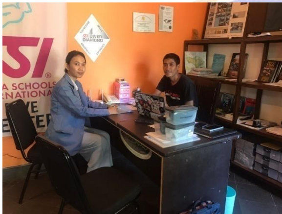
Dokumentasi wawancara bersama Pengelola Destinasi Wisata Pantai Relax