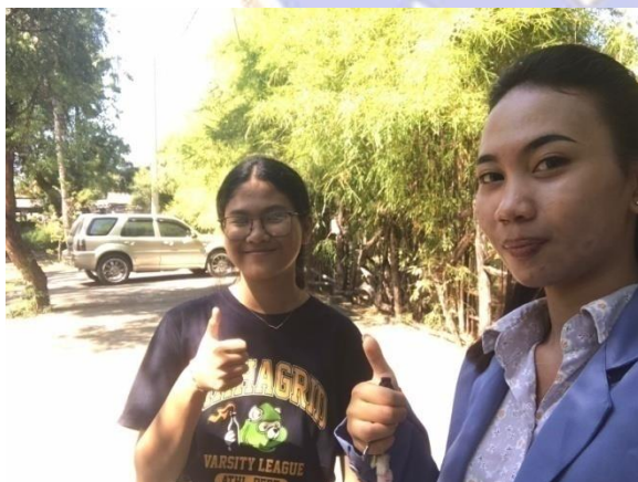
Dokumentasi wawancara bersama pengunjung