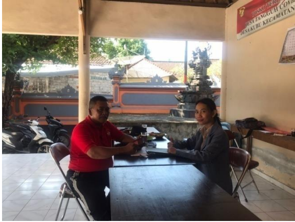
Dokumentasi wawancara bersama Kepala Desa Kubu