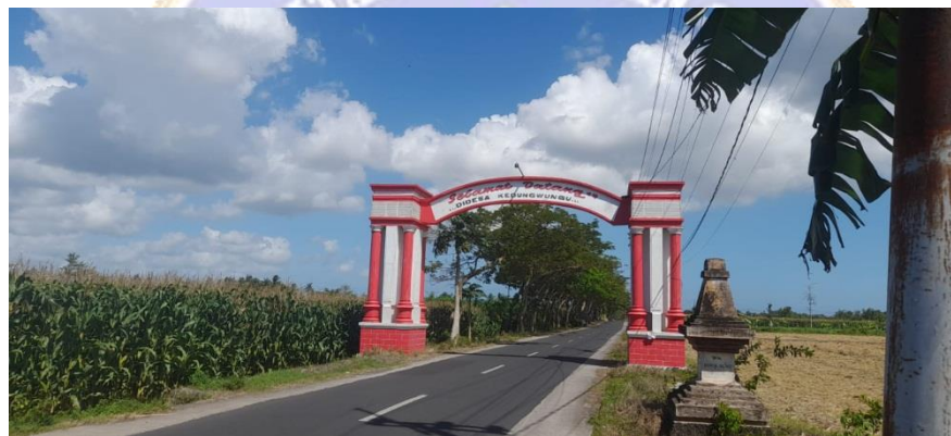
Tugu Selamat Datang Desa Kedungwungu