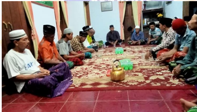
Kondisi Kegiatan Tahlilan Masyarakat Desa Kedungwugu