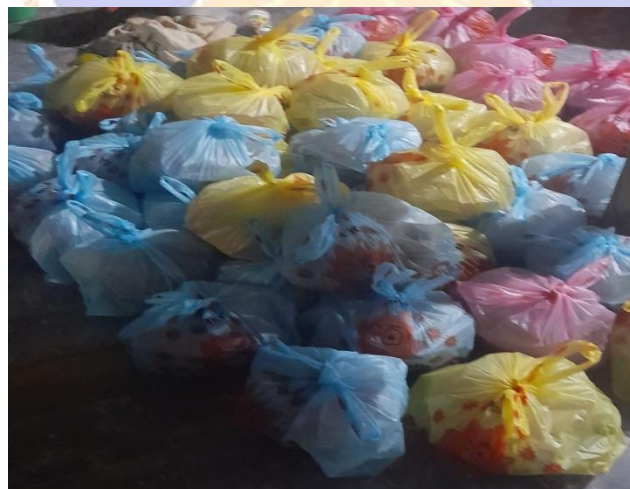
Berkat yang akan di Bagikan untuk Para Jama'ah Tahlil