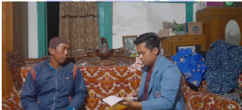
Wawancara Kepada salah satu Masyarakat Pelaku Tradisi Tahlilan Kepada Bapak Pairs