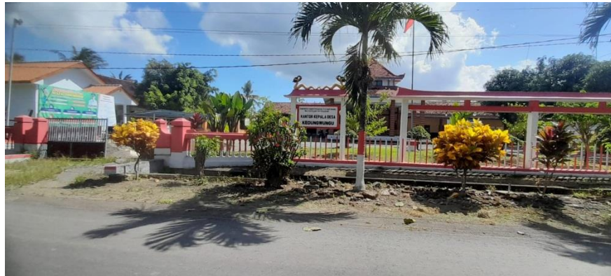
Lokasi Penelitian (Balai Desa Kedungwungu)