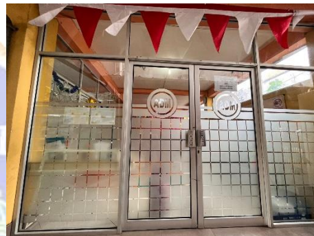
Gambar.16 Kantor Depan SMA Harapan Mulia