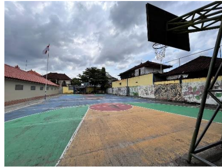
Gambar.14 Lapangan SMA Harapan Mulia