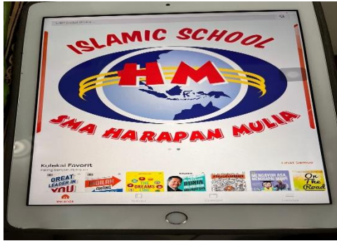
Gambar.13 Perpustakaan Digital