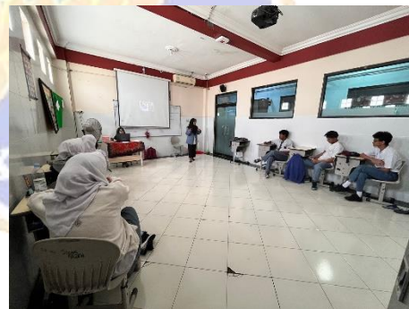
Gambar.6 Proses Kegiatan Belajar Mengajar di Kelas XI IIS