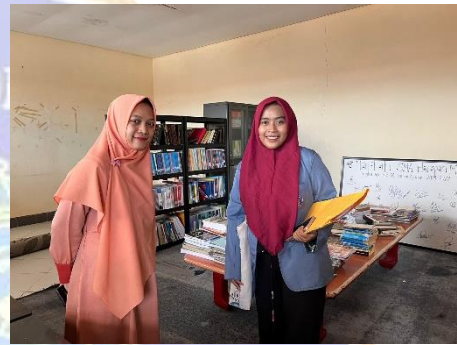
Gambar.4 Observasi lingkungan dan fasilitas sekolah.