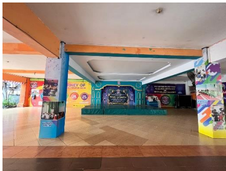
Gambar.15 Aula SMA Harapan Mulia