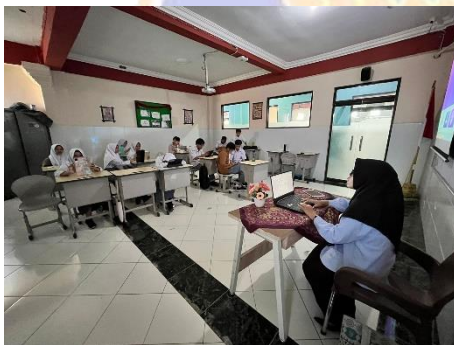
Gambar.5 Proses Kegiatan Belajar Mengajar di Kelas X IIS