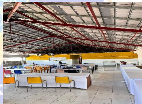
Gambar.18 Kantin SMA Harapan Mulia