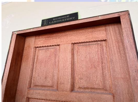
Gambar.17 Laboratorium SMA Harapan Mulia