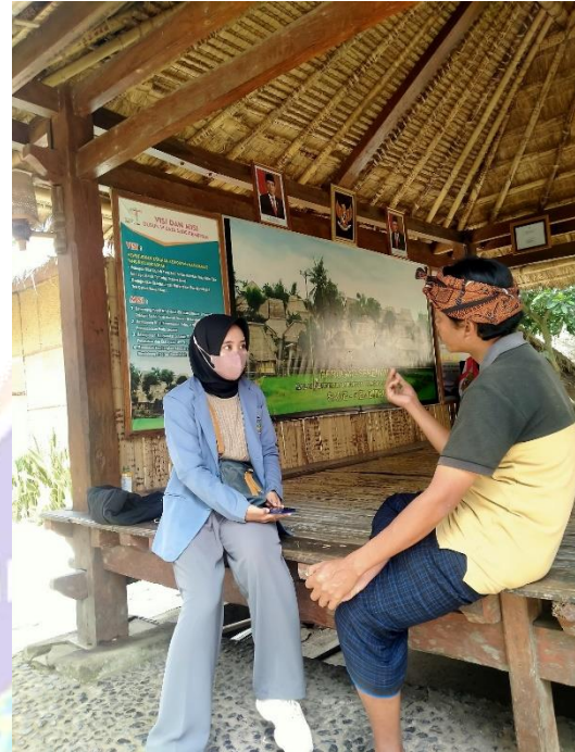
Gambar 02. Wawancara dengan informan