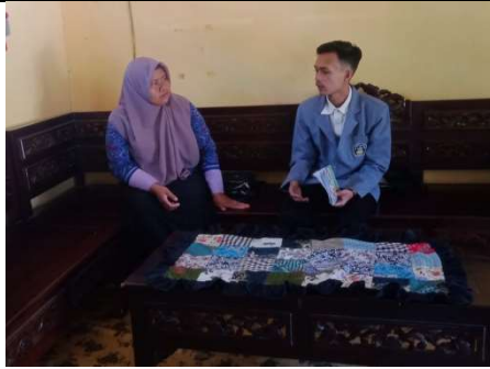
Gambar 5. Bersama Guru Sejarah MA Hidayatullah