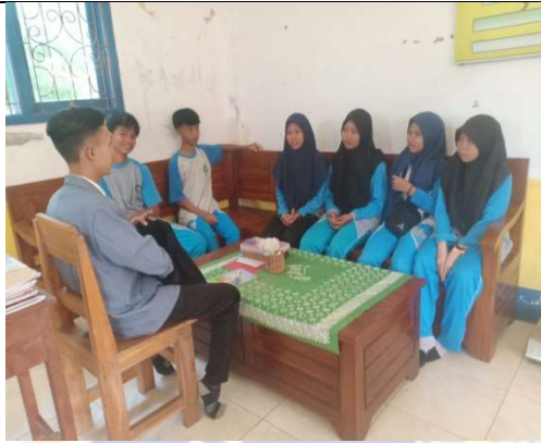
Gambar 6. Bersama siswa MA Hidayatullah