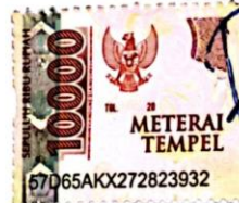
Gede Bayu Indrawan