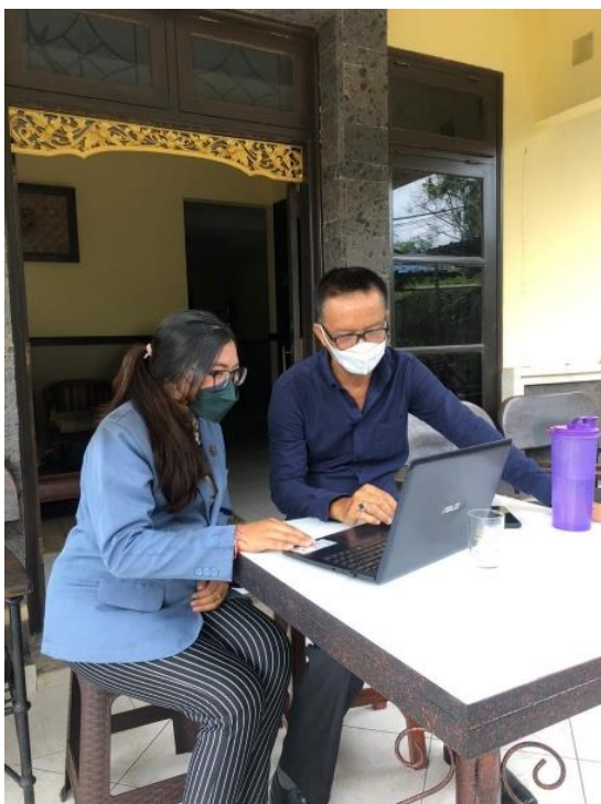
Sumber: Wawancara bersama guru Bahasa Indonesia.