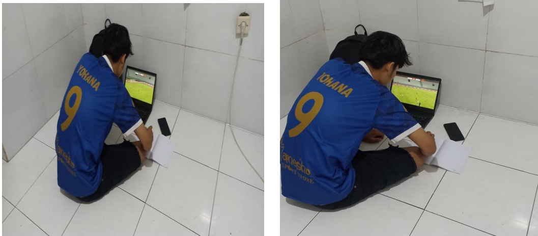
Foto Peneliti Saat Melakukan Analisis