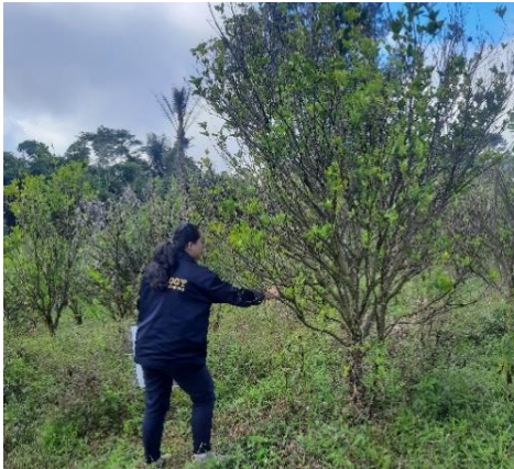
Lampiran 1. Pengambilan Sampel Daun yang Menunjukkan Gejala Penyakit CVPD