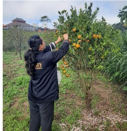
Lampiran 2. Pengambilan Sampel Daun yang Tidak Menunjukkan Gejala Penyakit CVPD