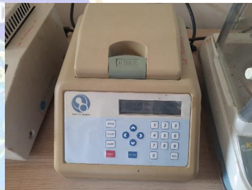
Lampiran 4. Proses Amplifikasi DNA dengan Teknik PCR