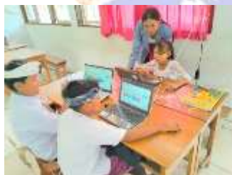
Uji Kelompok Kecil