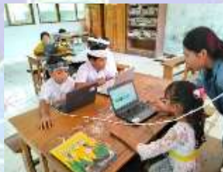
Uji Kelompok Kecil