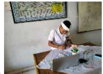
Penarikan Respon Guru II