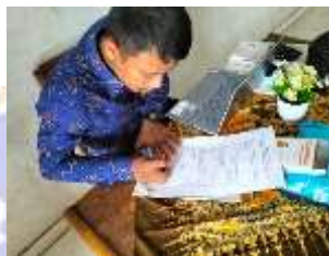
Penarikan Respon Guru I