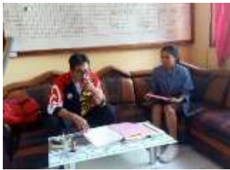
Permohonan Izin Observasi