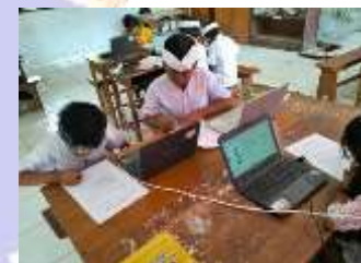
Penarikan Respon Siswa