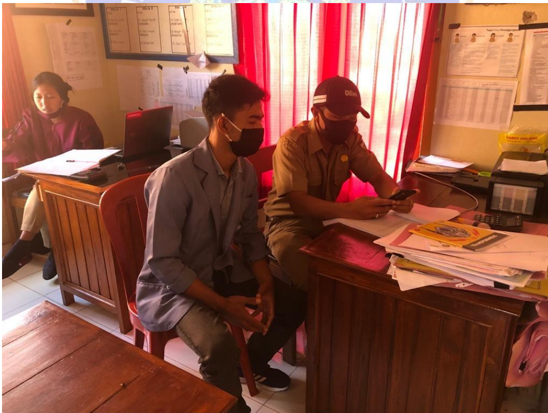
Keterangan : Foto pada waktu peneliti melakukan wawancara dengan kepala