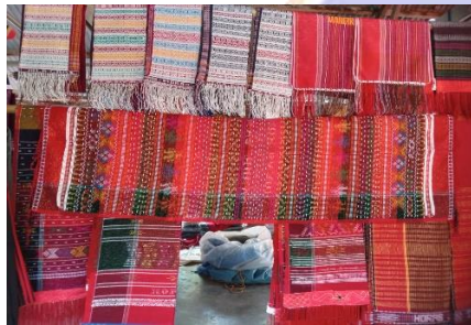
Foto ulos di pasar rabu Hutabayu Raja, lokasi pemasaran ulos (8 Maret 2023).