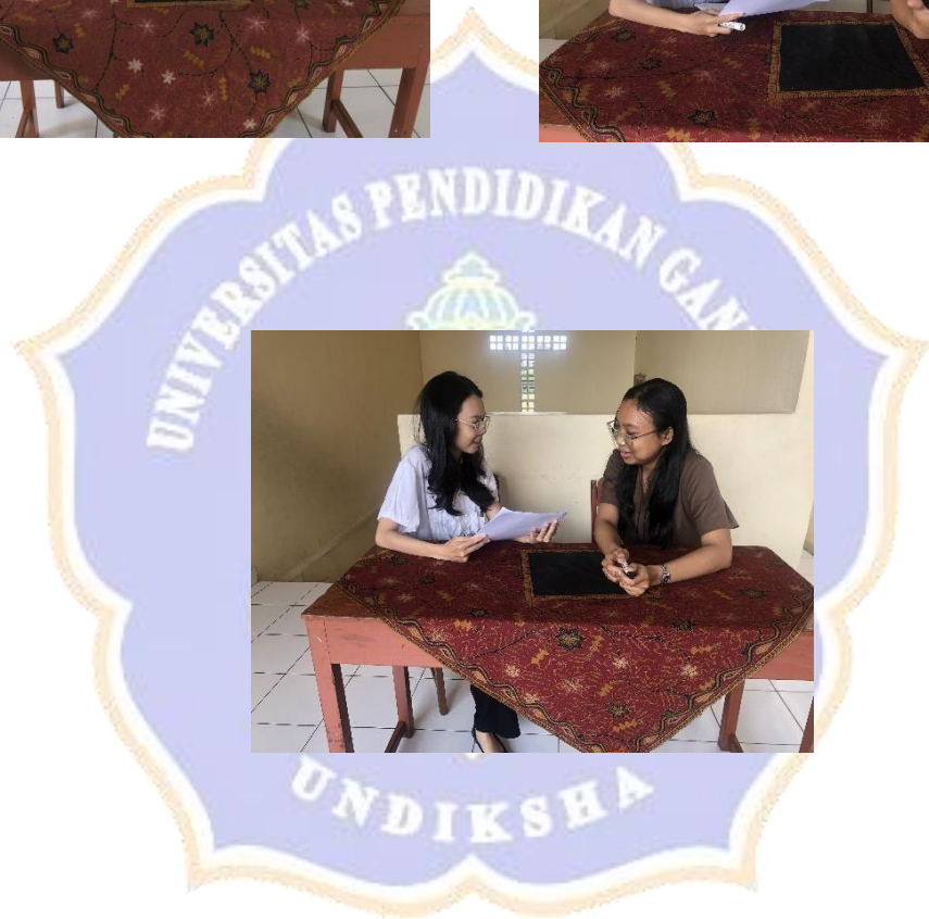
Proses wawancara pada guru matematika