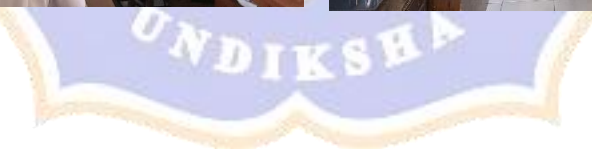
Suasana kelas saat proses pembelajaran