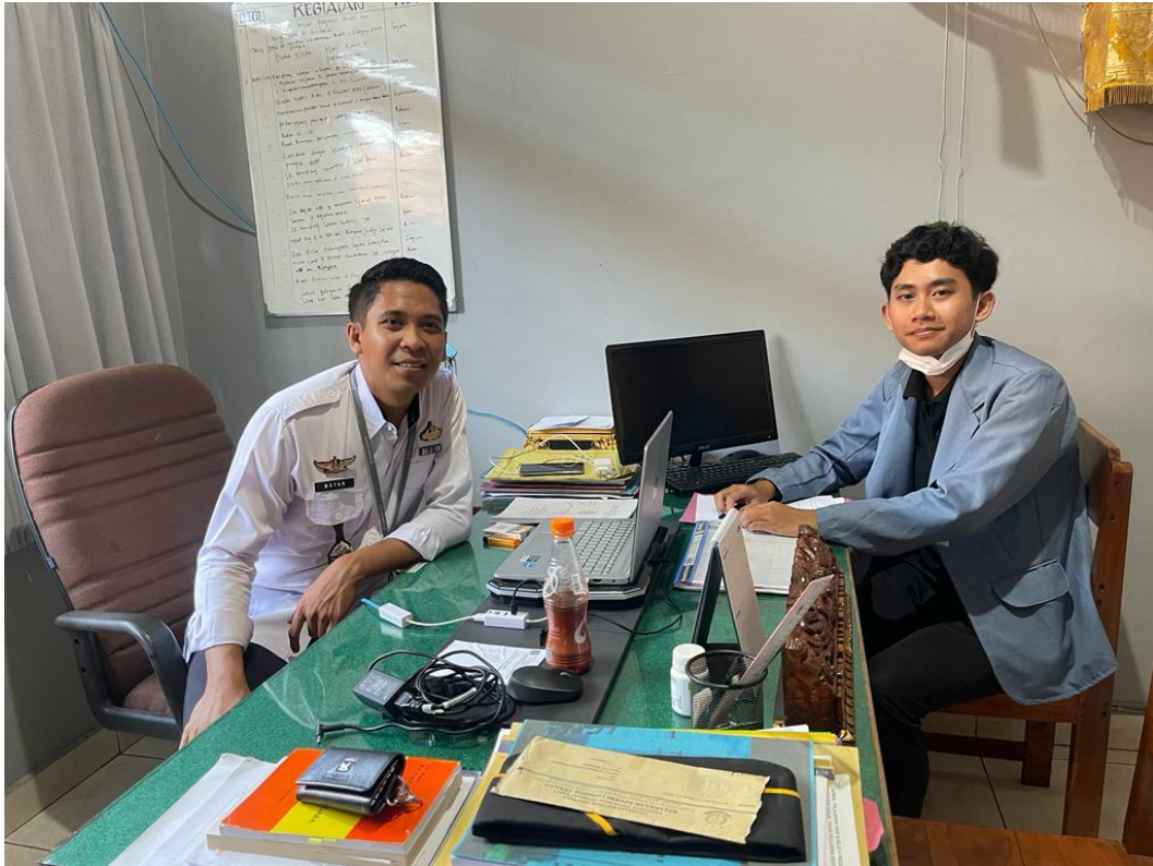
FOTO BERSAMA NARASUMBER 2