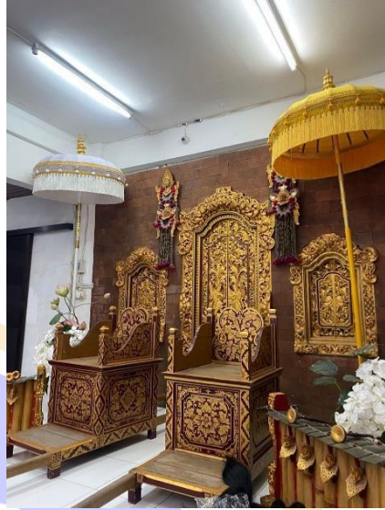
Dokumentasi salah satu lokasi penelitian