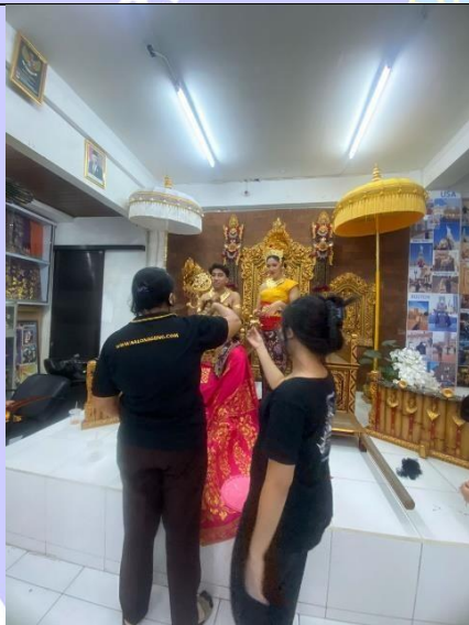
Observasi pada LKP Salon Agung