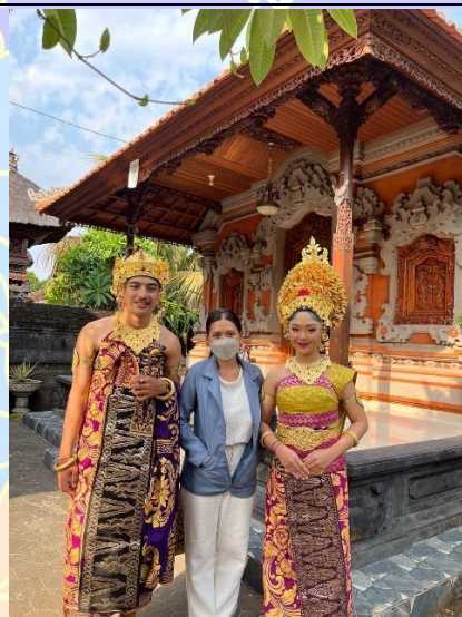
Praktik Tata Rias Pengantin Agung Mengwi di Sanggar Tari Bali "Sekar Bumi"