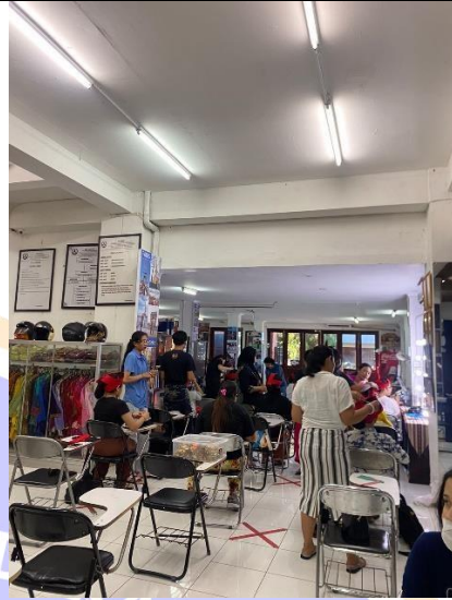
Observasi pada LPK Salon Agung