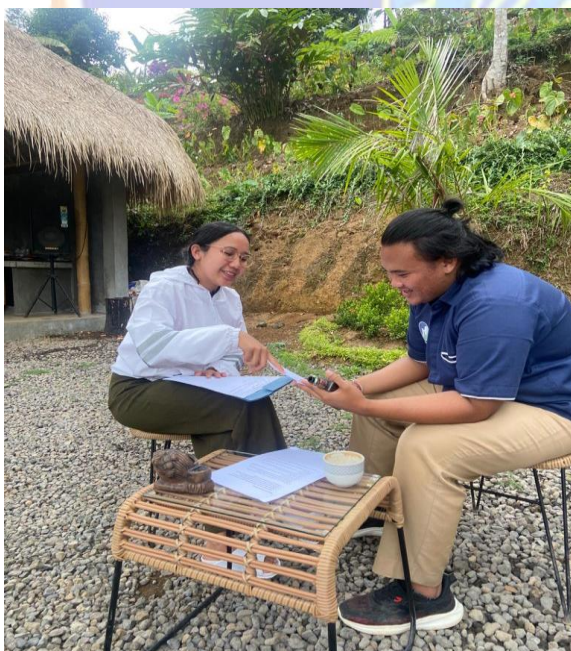
Wawancara Supervisor The Selosa