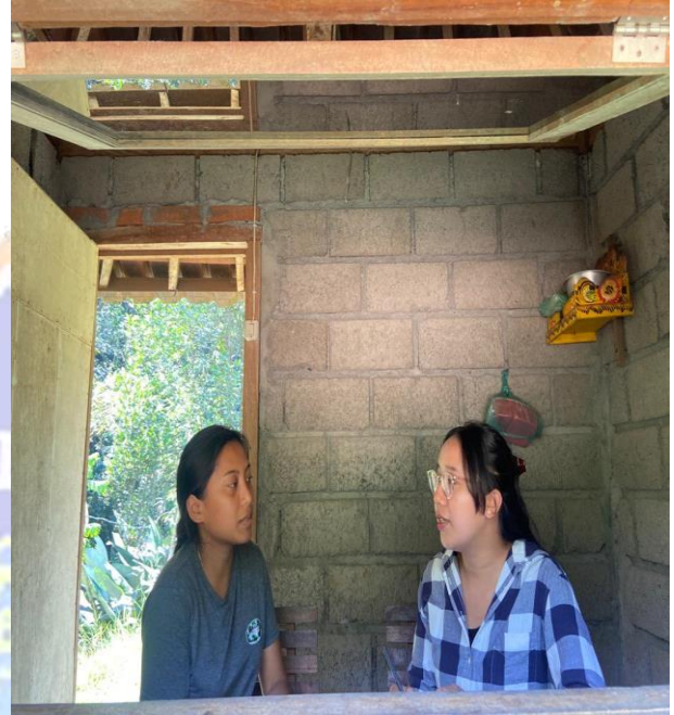
Wawancara Staf The Selosa