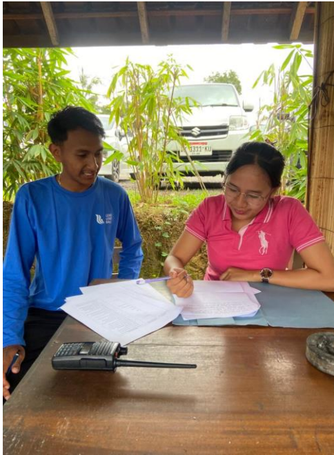
Wawancara Supervisor The Selosa