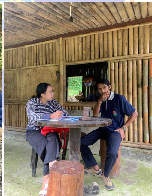
Wawancara Owner The Selosa