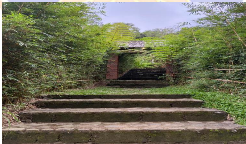
Foto 2. Pintu masuk menuju The Selosa