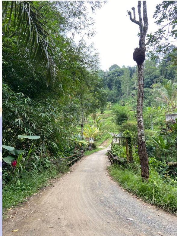
Foto 1. Kondisi jalan menuju The Selosa