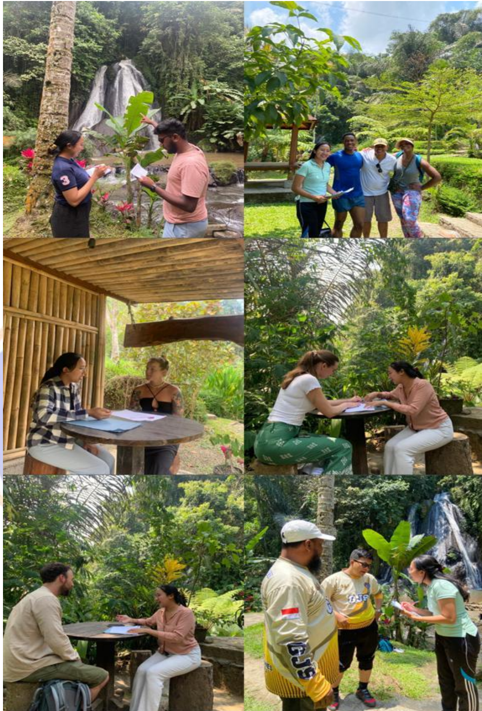
Foto 5. Dokumentasi Wawancara dengan Pengunjung The Selosa