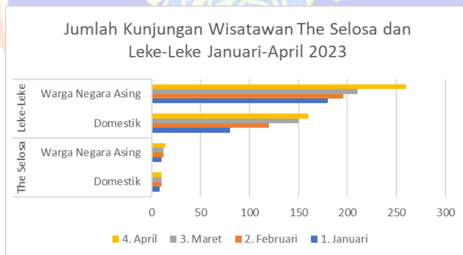
Grafik 1. Perbandingan Kunjungan Wisatawan Destinasi Wisata The Selosa dan Leke-Leke