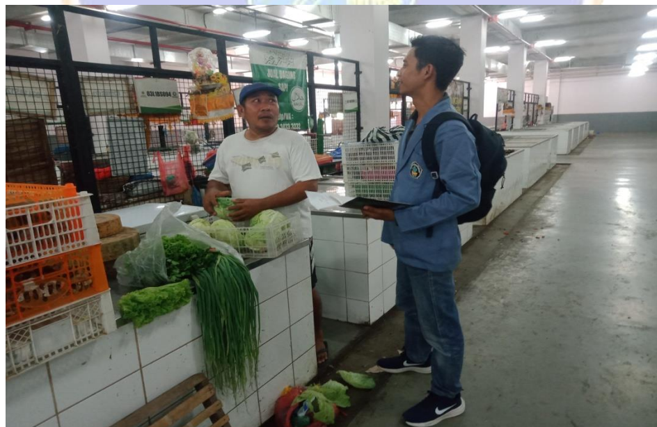
Wawancara dengan pedagang sayur