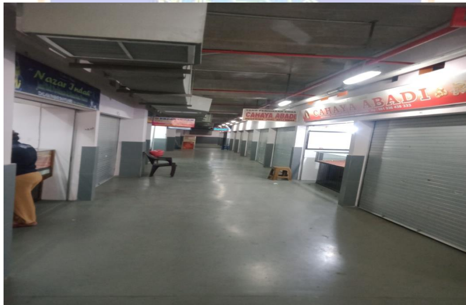
Situasi pasar di lantai II