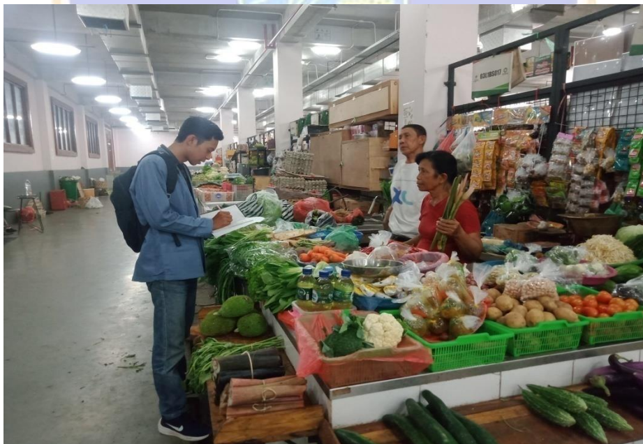
Wawancara dengan pedagang sayur mayur