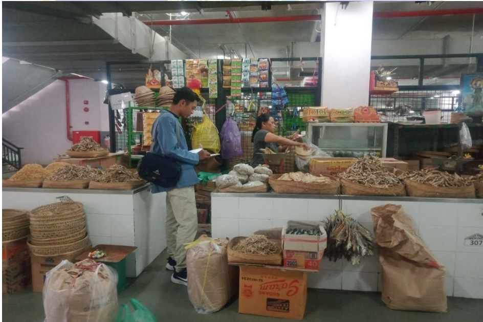
Wawancara dengan pedagang ikan kering