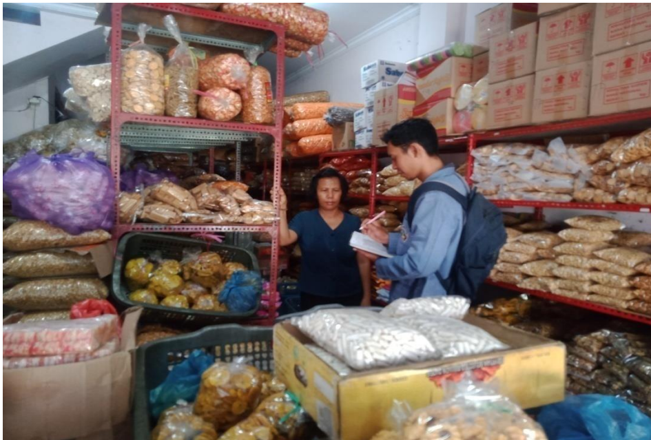
Wawancara dengan pedagang roti