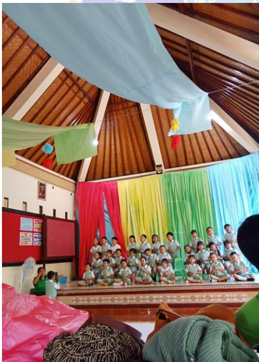
The Process of Learning