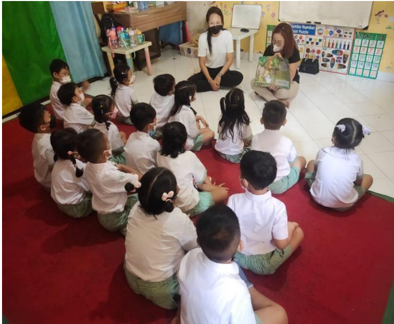
Activity with Community