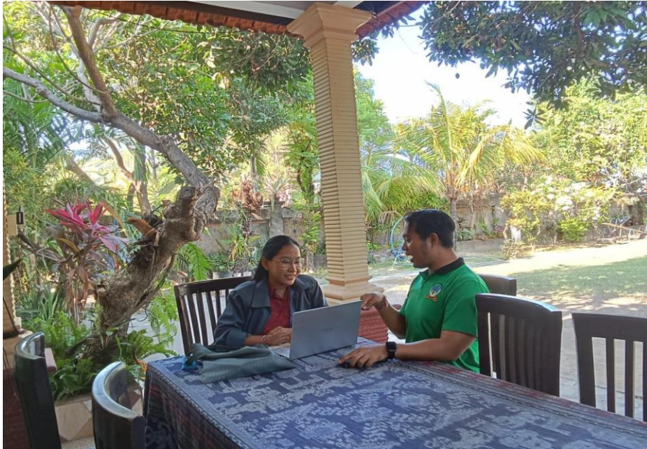
Interview with school headmaster