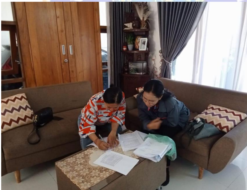
Interview with parent