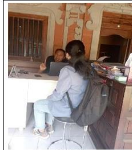
Gambar 2 Dokumentasi Pengumpulan Data Kepala Lingkungan Pesanggaran