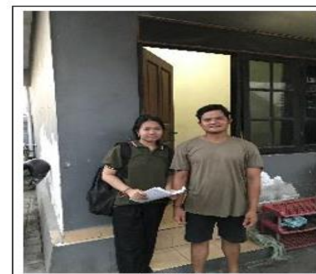
Gambar 6 Dokumentasi Pengumpulan Data di Kawasan TPA Suwung