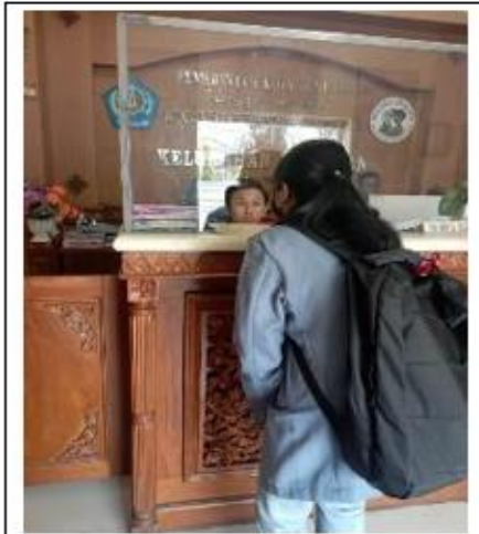
Gambar 1 Dokumentasi Pengumpulan Data di Kelurahan Pedungan