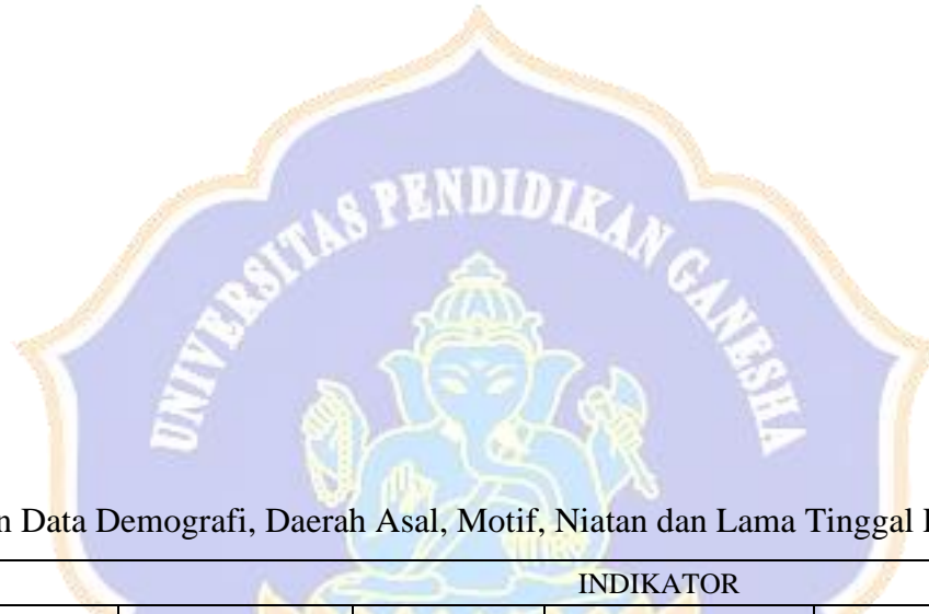
Lampiran 5 Berkas Hasil Pengumpulan Data Demografi, Daerah Asal, Motif, Niatan dan Lama Tinggal Penduduk Migran