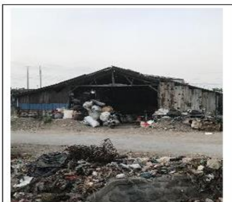
Gambar 5 Dokumentasi Pemukiman Non Permanen di Kawasan TPA Suwung