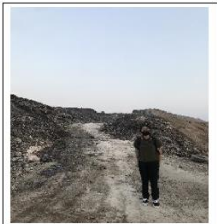
Gambar 3 Dokumentasi Pegunungan Sampah di Kawasan TPA Suwung