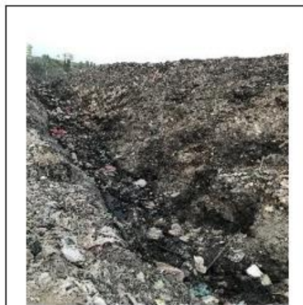
Gambar 4 Dokumentasi Sampah di Kawasan TPA Suwung