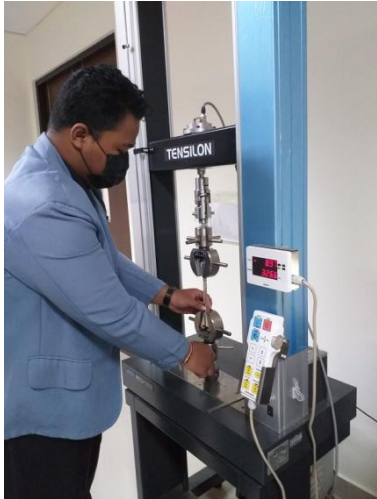
Proses Pemasangan Spesimen Ke Alat Uji Tarik