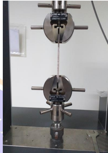
Proses Uji Tarik