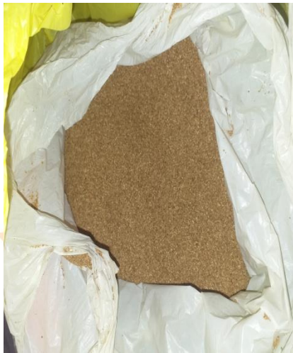
Serbuk Kayu Jati