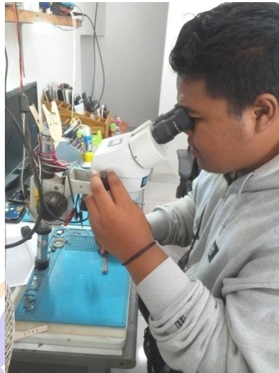
Proses Pengambilan Gambar Pola Patahan Spesimen

c. Dokumentasi Pengambilan Gambar Pola Patahan Dengan Alat Mikroskop