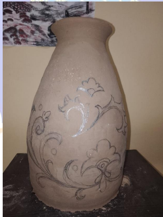
Gambar 12 Menggambar pola motif pada karya gerabah berjudul “Taman Bunga”