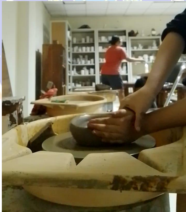
Gambar 20 Proses membentuk tanah liat