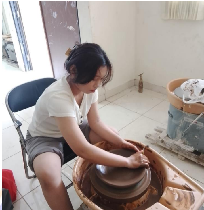
Gambar 23 Proses membentuk tanah liat