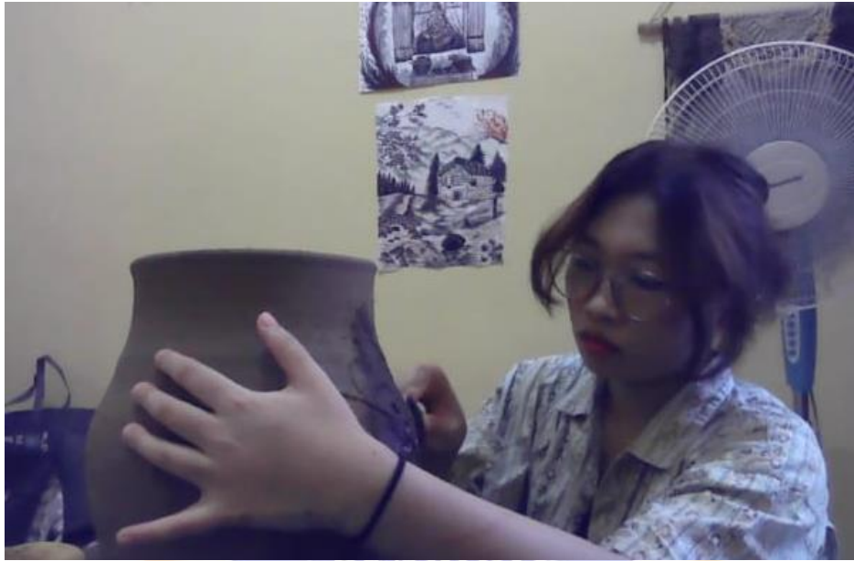
Gambar 25 Proses Mengukir pada karya gerabah