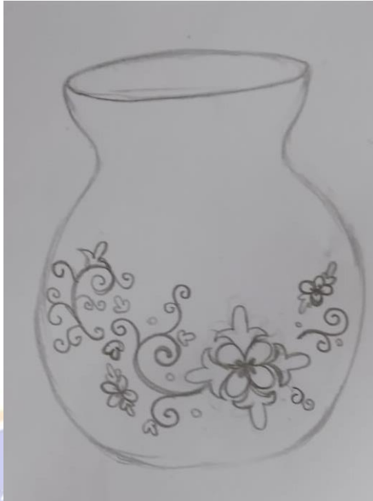
Gambar 5 Sketsa Karya gerabah berjudul “Biring Manggis”