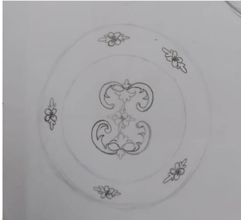
Gambar 3 Sketsa Karya gerabah berjudul “Berseri”