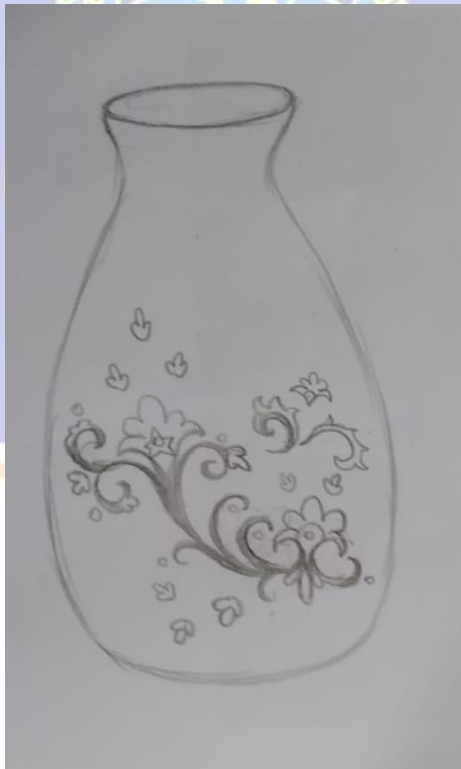
Gambar 6 Sketsa Karya gerabah berjudul “Taman Bunga”