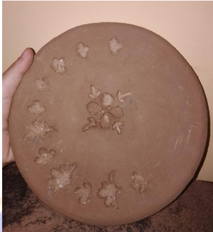
Gambar 13 Mengukir motif Batak Karo pada karya gerabah berjudul “Anak Bunga”