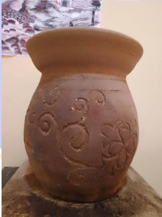
Gambar 18 Mengukir motif Batak Karo pada karya gerabah berjudul "Biring Manggis"