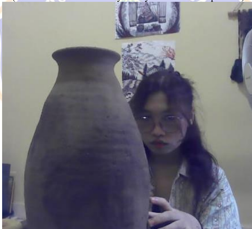
Gambar 26 Proses Mengukir pada karya gerabah