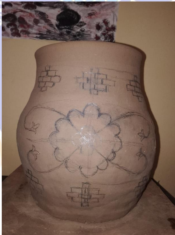
Gambar 10 Menggambar pola motif pada karya gerabah berjudul “Mewangi”