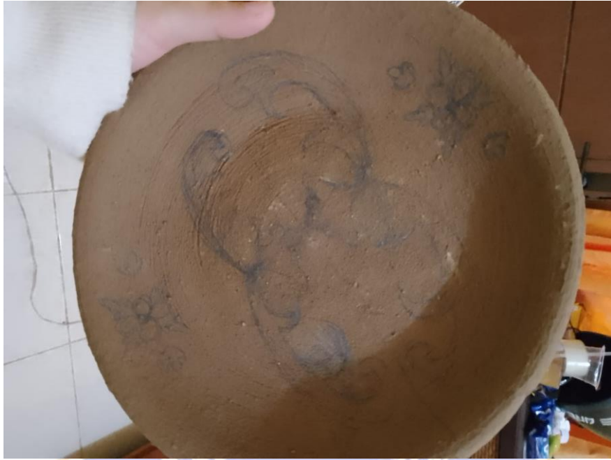
Gambar 9 Menggambar pola motif pada karya gerabah berjudul “Merekah”