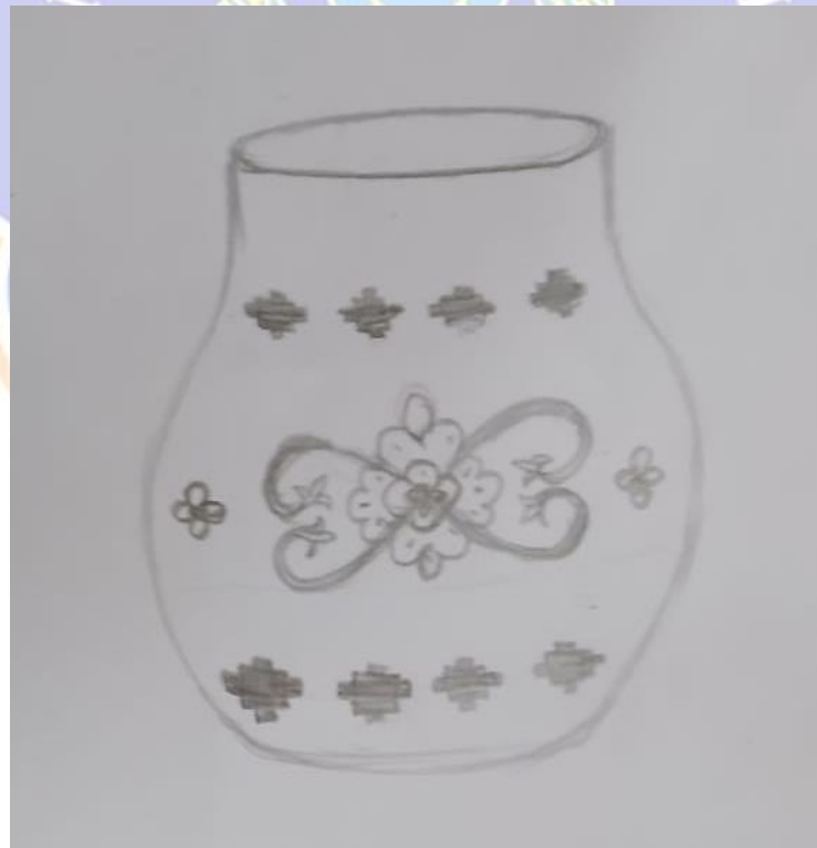
Gambar 4 Sketsa Karya gerabah berjudul “Mewangi”