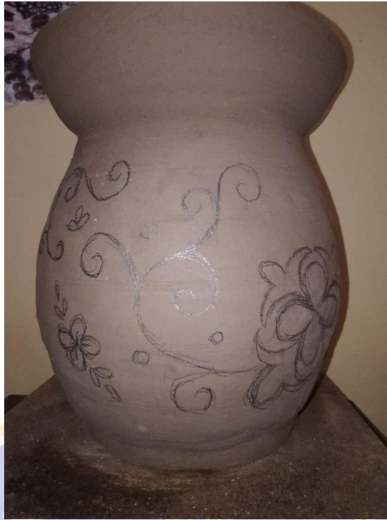
Gambar 11 Menggambar pola motif pada karya gerabah berjudul “Biring Manggis”