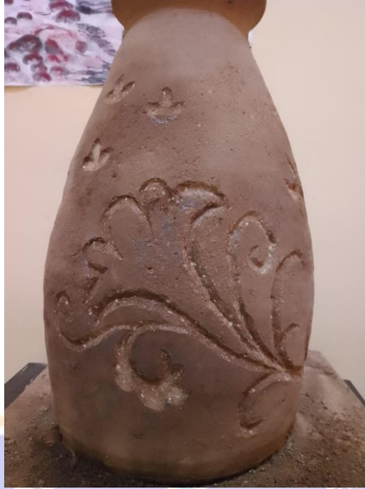
Gambar 17 Mengukir motif Batak Karo pada karya gerabah berjudul "Berseri"