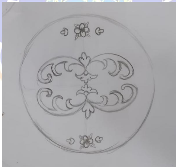
Gambar 2 Sketsa Karya gerabah berjudul “Merekah”