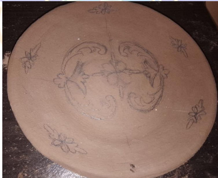
Gambar 8 Menggambar pola motif pada karya gerabah berjudul “Berseri”