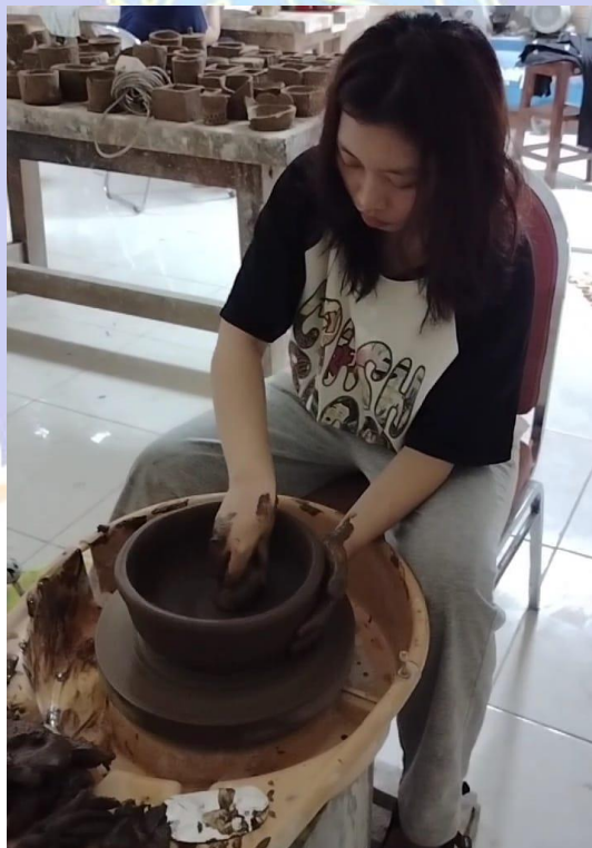
Gambar 22 Proses membentuk tanah liat