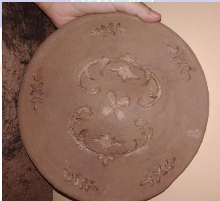
Gambar 14 Mengukir motif Batak Karo pada karya gerabah berjudul “Berseri”