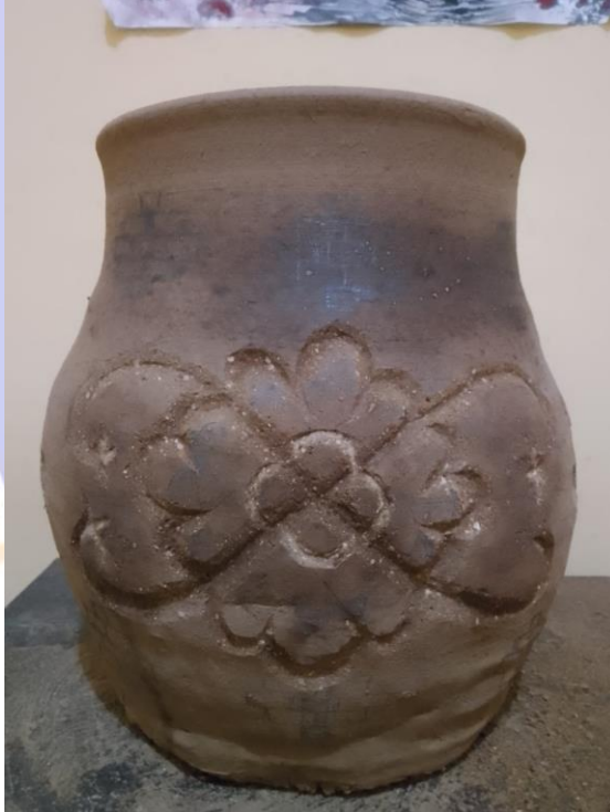
Gambar 16 Mengukir motif Batak Karo pada karya gerabah berjudul "Mewangi"