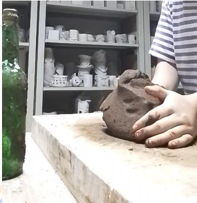
Gambar 19 Proses menguleni tanah liat