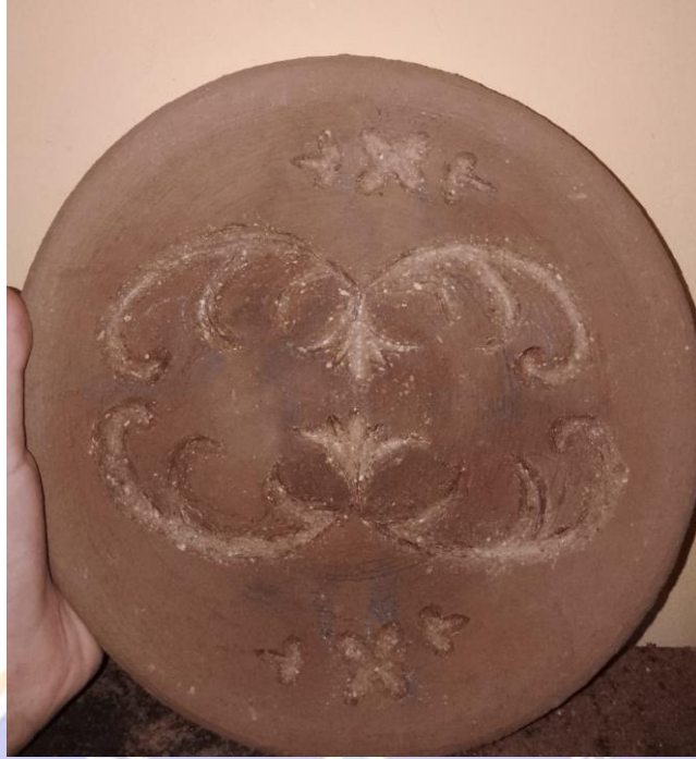
Gambar 15 Mengukir motif Batak Karo pada karya gerabah berjudul "Berseri"