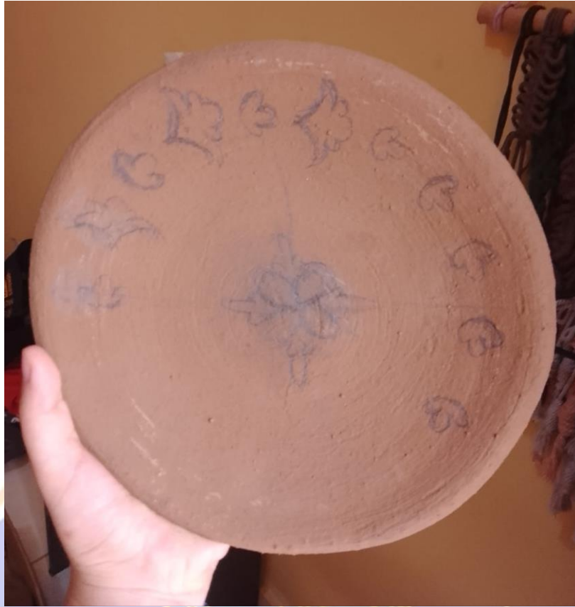
Gambar 7 Menggambar pola motif pada karya gerabah berjudul “Anak Bunga”