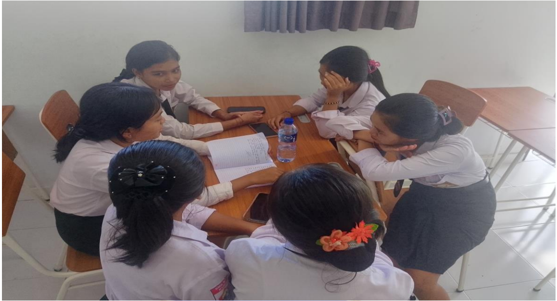
Siswa berdiskusi di kelompok asal