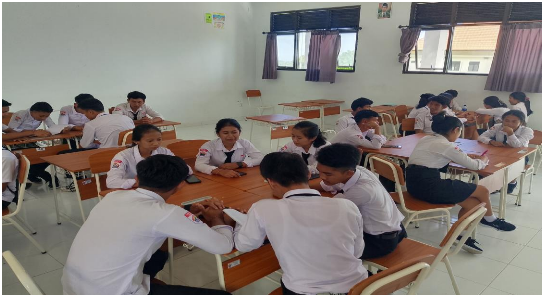
Siswa berdiskusi di kelompok ahli