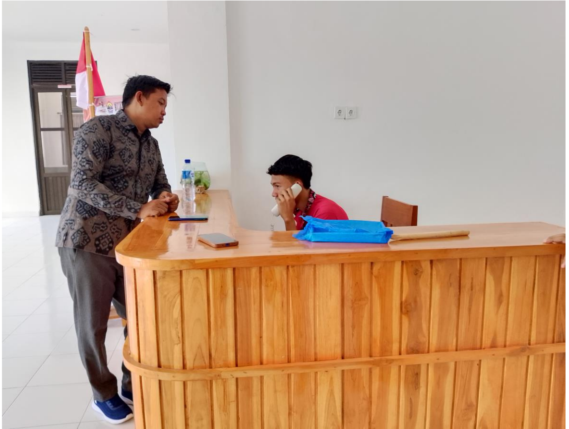
Siswa melaksanakan praktik menangani telephone operator pada Siklus II