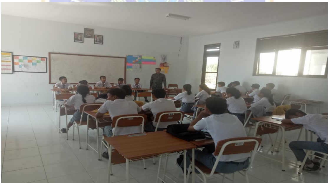
Peneliti mendampingi masing-masing kelompok asal dalam mempresentasikan hasil diskusi kelompok.