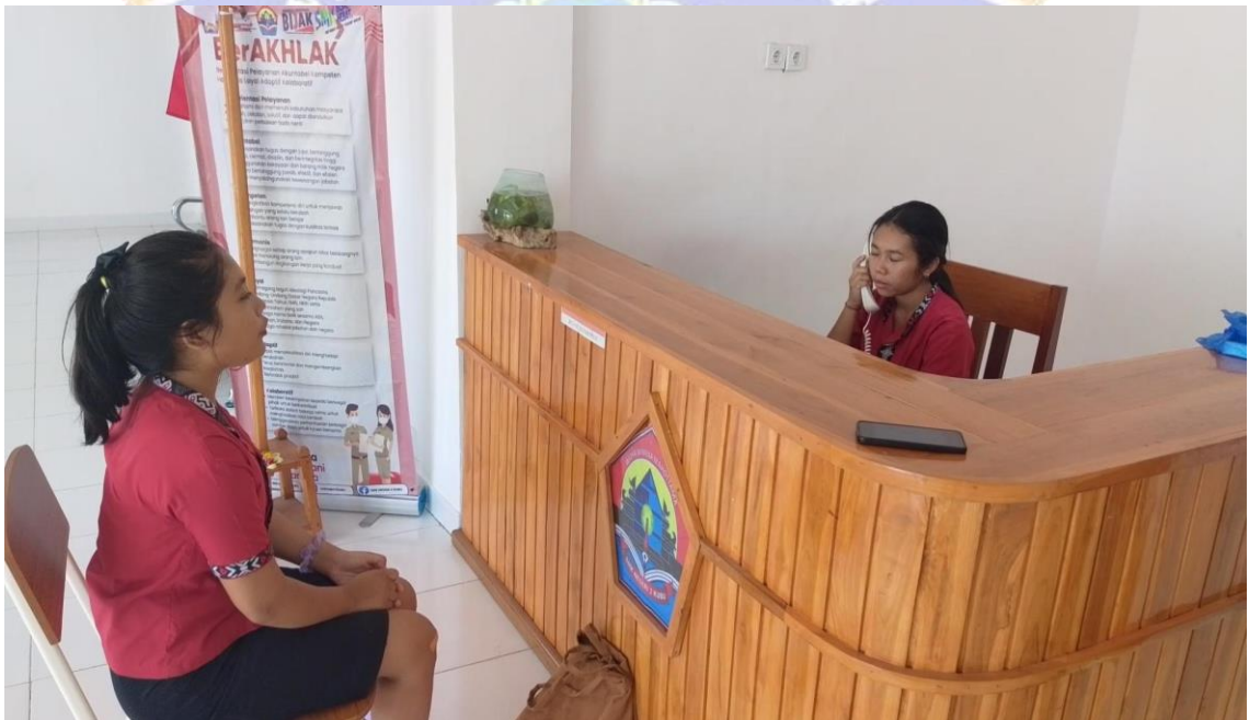
Siswa melaksanakan praktik menangani telephone operator pada Siklus I