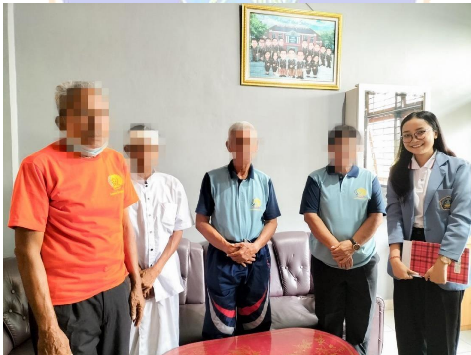
Lampiran 10. Wawancara bersama narapidana lanjut usia (lansia) di Lembaga Pemasyarakatan Kelas IIB Singaraja