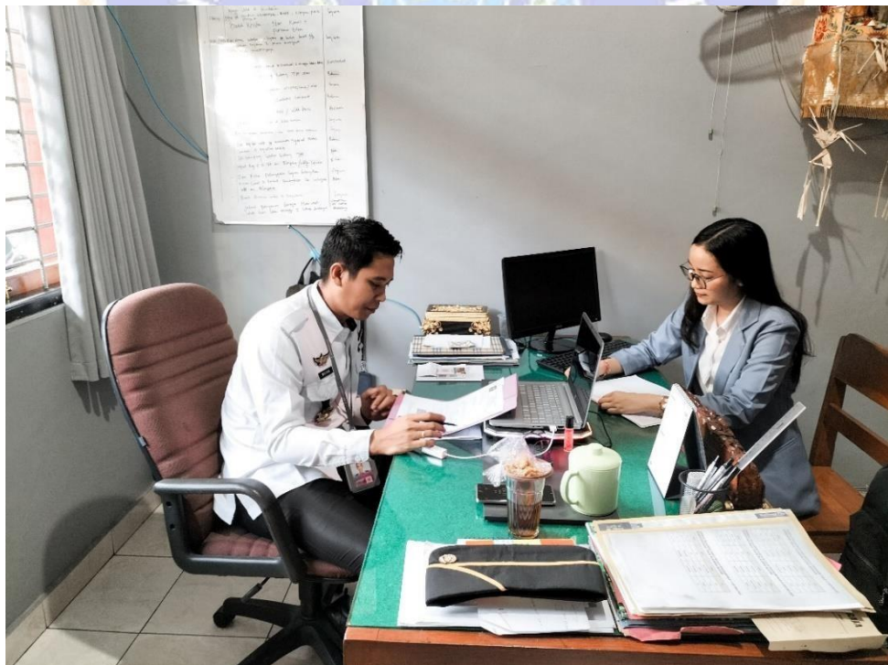
Lampiran 7. Wawancara bersama Kepala Seksi Pembinaan Narapidana/ Anak Didik dan Kegiatan Kerja Lembaga Pemasyarakatan Kelas IIB Singaraja