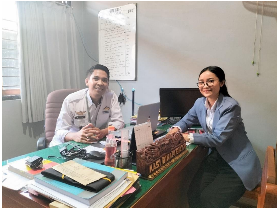
Lampiran 8. Wawancara bersama Kepala Seksi Pembinaan Narapidana/ Anak Didik dan Kegiatan Kerja Lembaga Pemasyarakatan Kelas IIB Singaraja