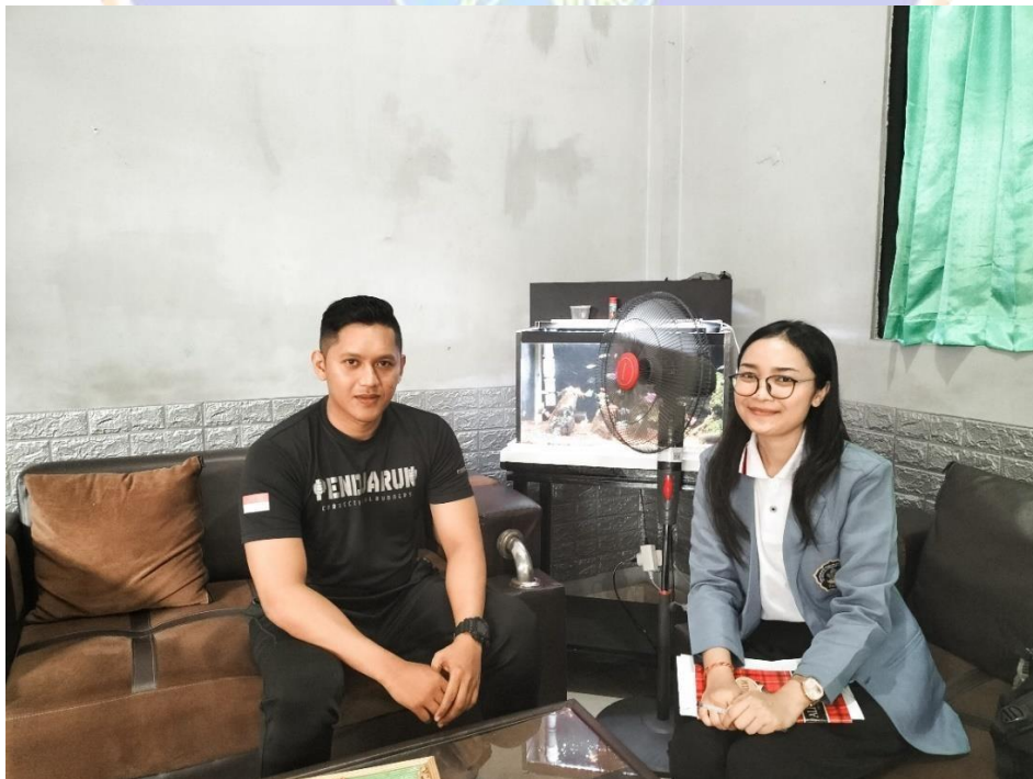
Lampiran 9. Wawancara bersama petugas pembinaan narapidana di Lembaga Pemasyarakatan Kelas IIB Singaraja