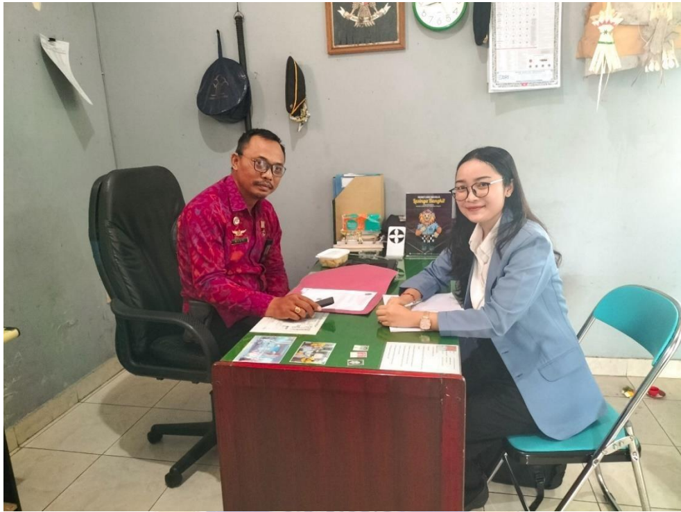
Lampiran 6. Pengajuan surat permohonan penelitian ke Lembaga Pemasyarakatan Kelas IIB Singaraja dan Kanwil Bali