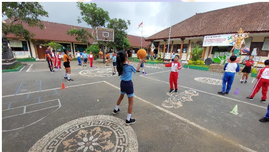
Gambar 8 Mengkoordinasikan Kelompok Belajar ( pairing )