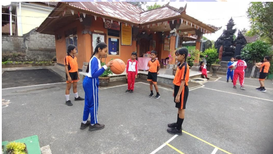
Gambar 13 Membimbing Penyelidikan Individu/Kelompok