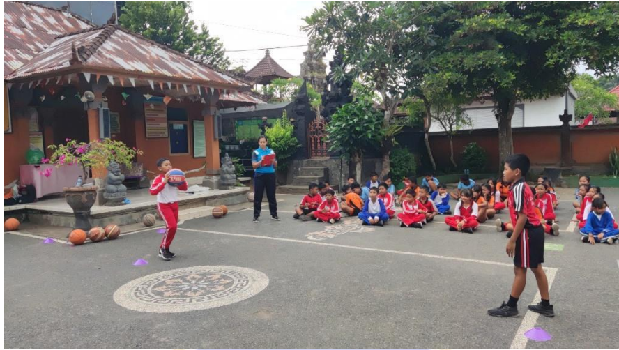
Gambar 10 Pelaksanaan Penilaian