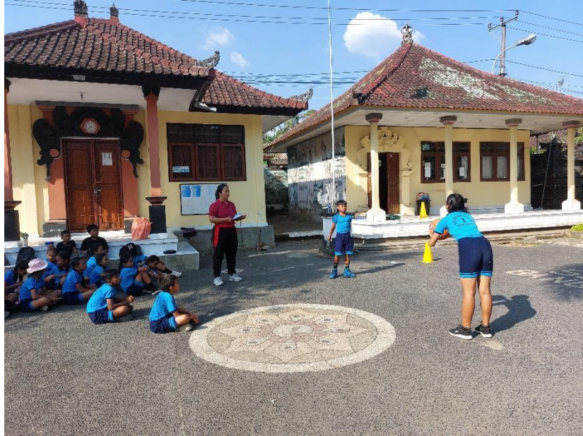
Gambar 1 Uji coba instrument hasil belajar bola basket ( chest pass )