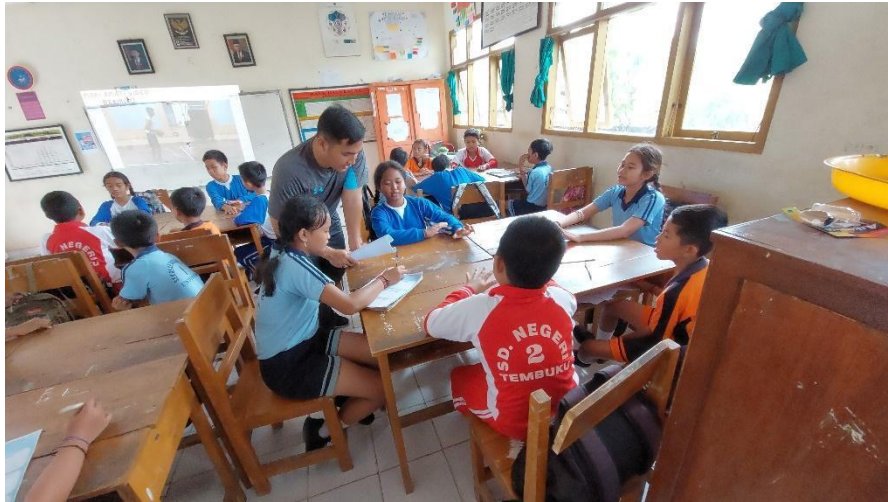
Gambar 12 Mengorganisasikan Peserta Didik ke dalam Kelompok Belajar