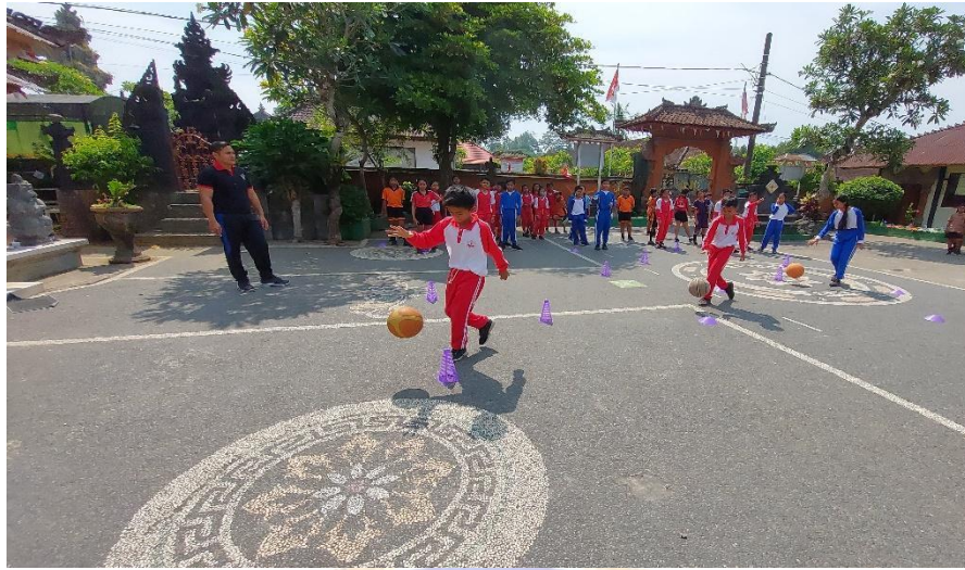
Gambar 14 Mengembangkan dan Menyajikan Hasil Karya