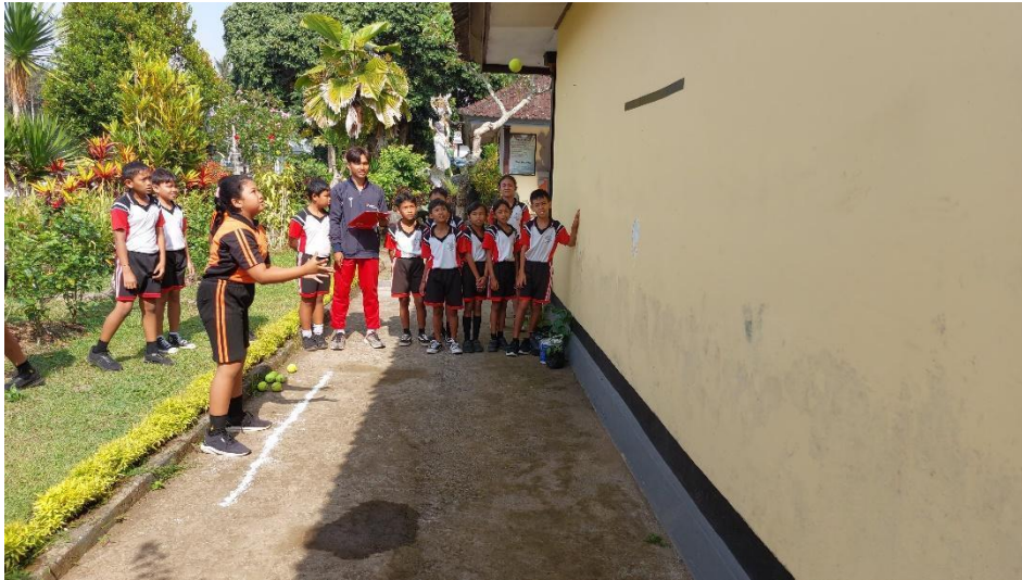
Gambar 5 Tes koordinasi mata tangan