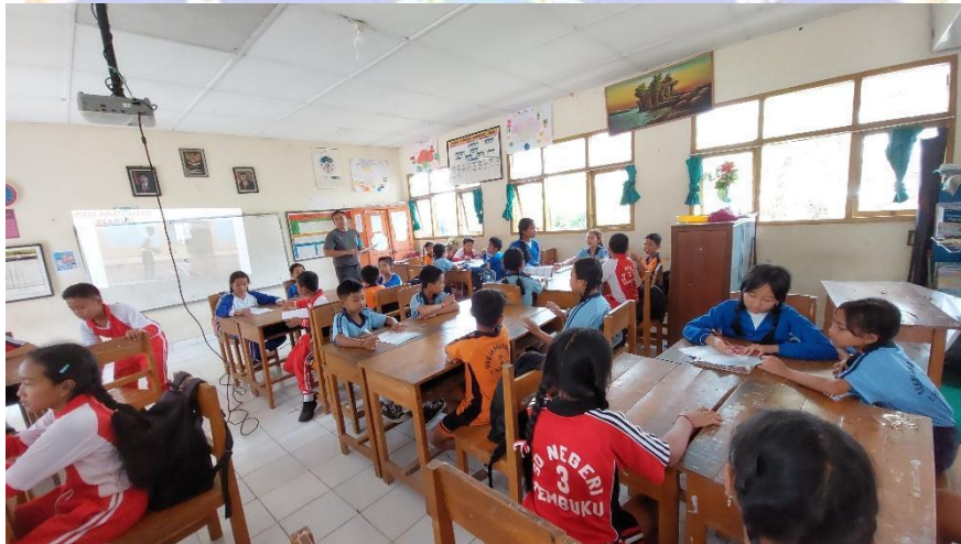
Gambar 11 Orientasi Pada Masalah