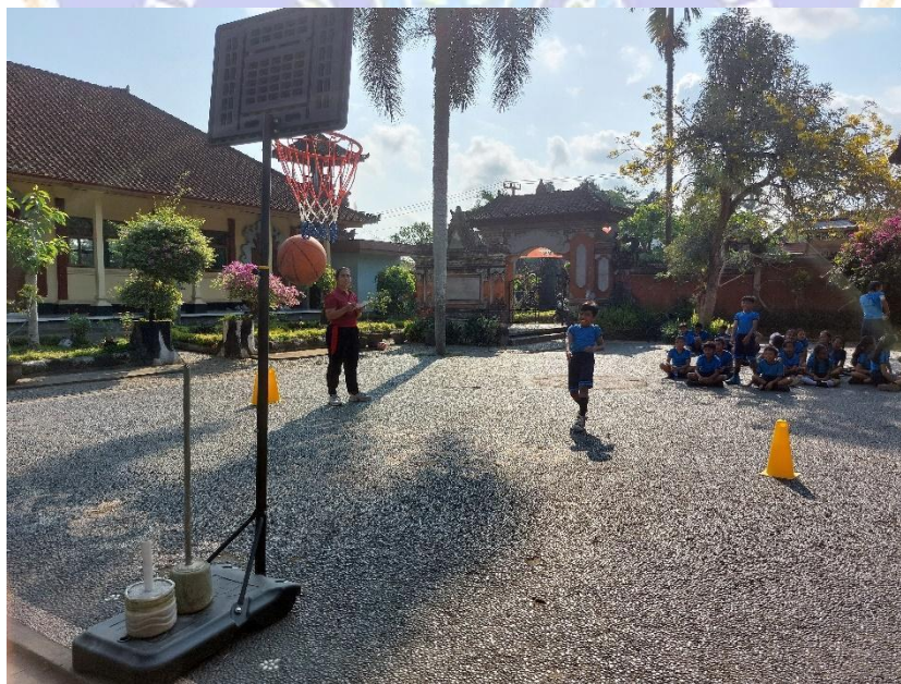
Gambar 2. Uji coba instrument hasil belajar bola basket ( shooting )