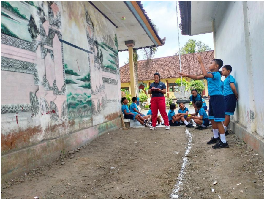
Gambar 3 Uji coba tes koordinasi mata tangan ( Child Ball Test )