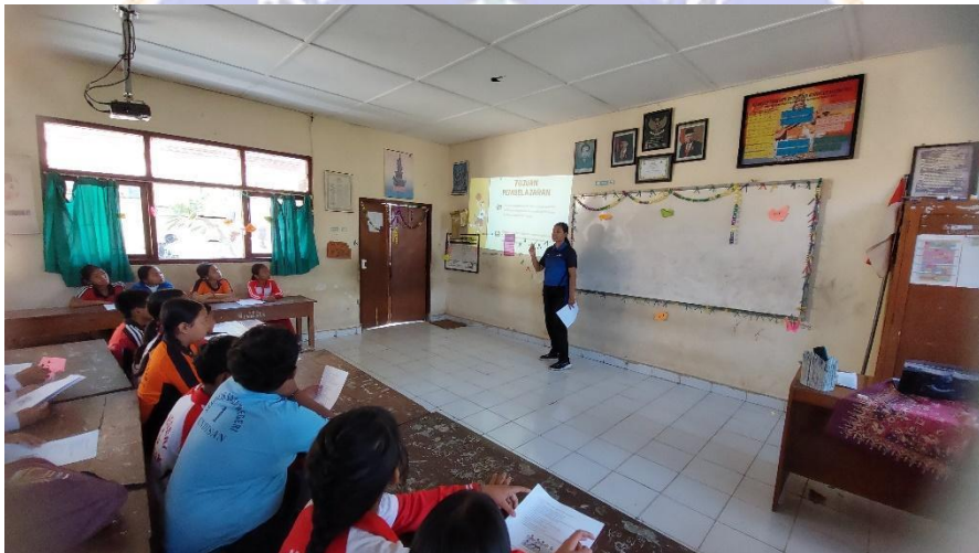
Gambar 6 Menyampaikan tujuan pembelajaran dan penyajian materi bola basket ( thinking )