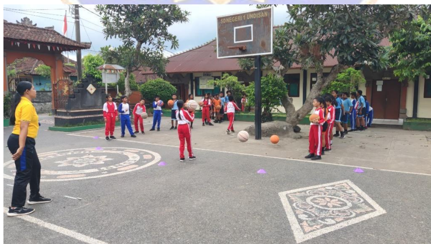
Gambar 9 Evaluasi ( Sharing ) dan Pemberian Penghargaan