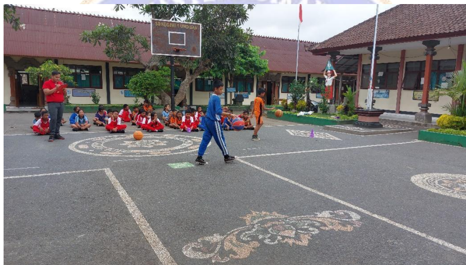
Gambar 15 Evaluasi Pemecahan Masalah