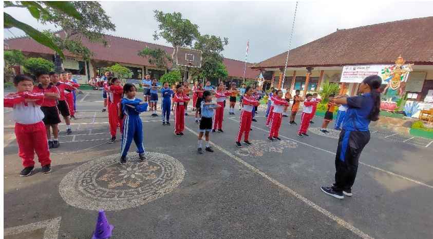
Gambar 7 Pemanasan