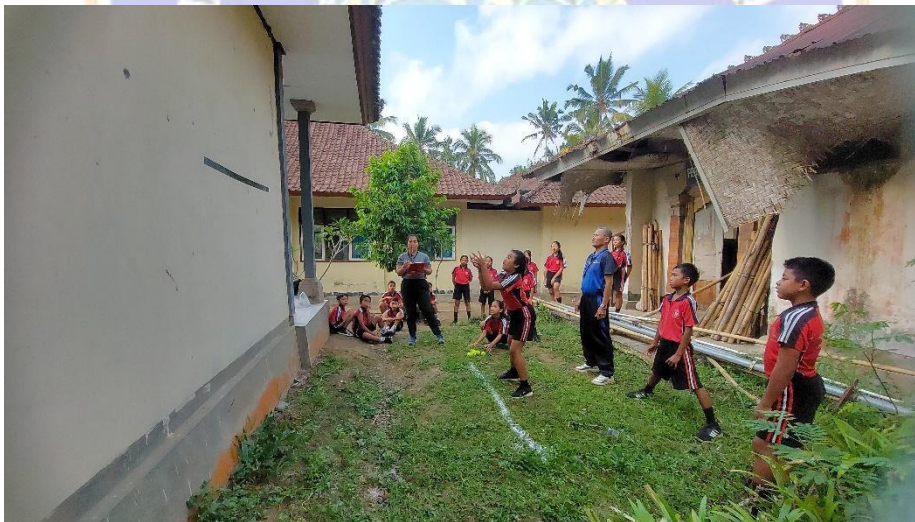
Gambar 4 Tes koordinasi mata tangan