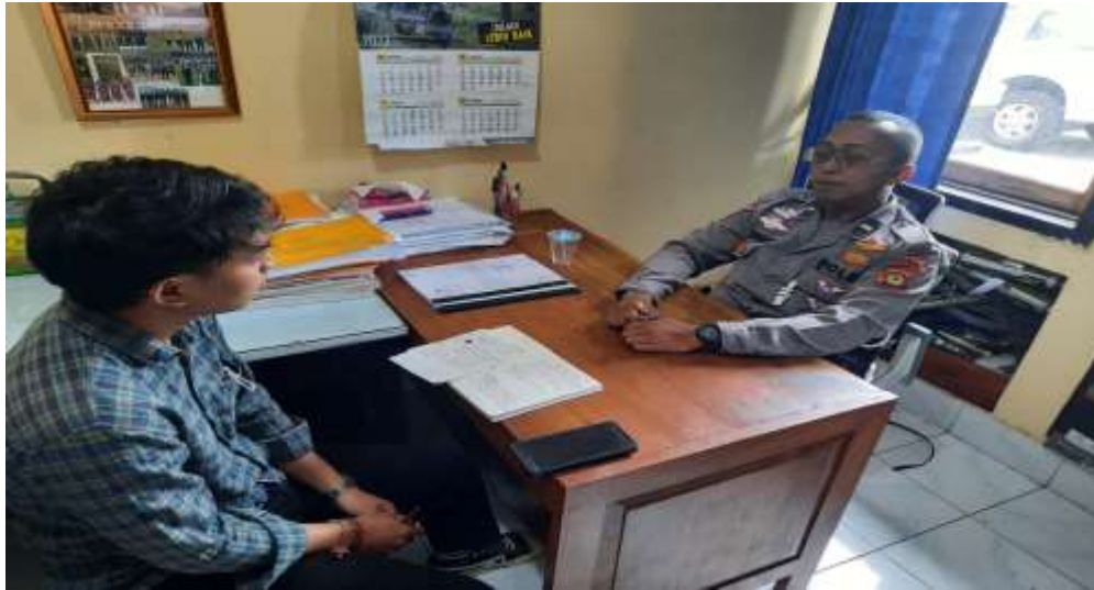
Foto Bersama Narasumber