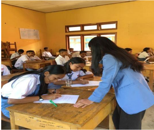
Gambar 3 Wawancara tertulis siswa kelas XI