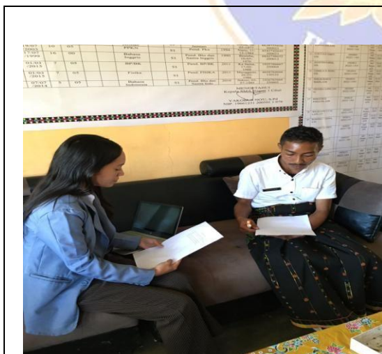
Gambar 1 Wawancara bersama guru Geografi kelas XI