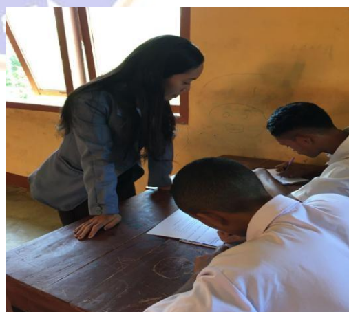
Gambar 2 Wawancara tertulis siswa kelas XI