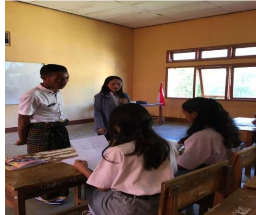
Gambar 4 Wawancara tertulis siswa kelas XI