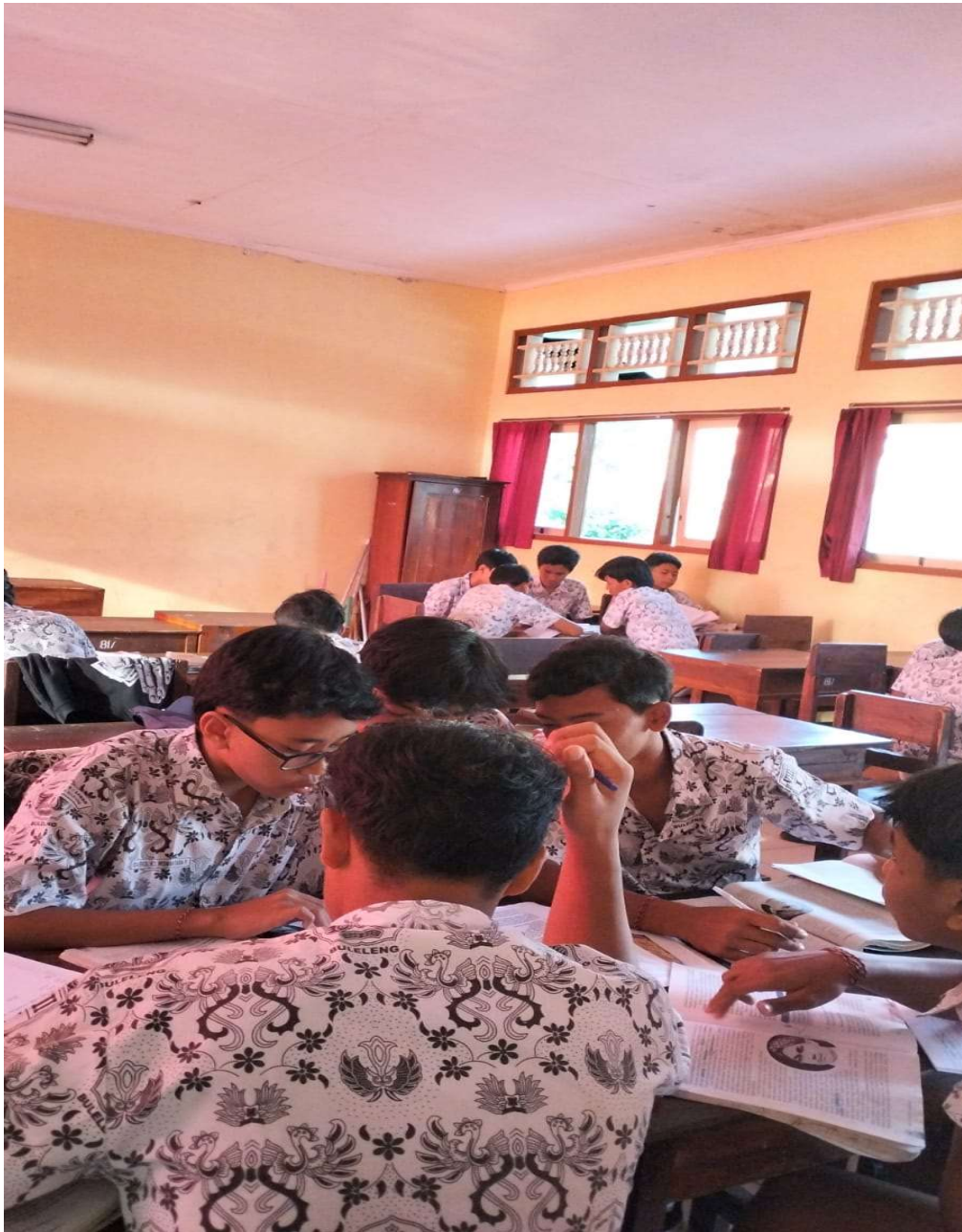
Wawancara dengan siswa