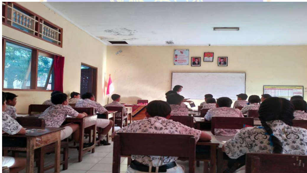
Proses berlangsungnya belajar mengajar