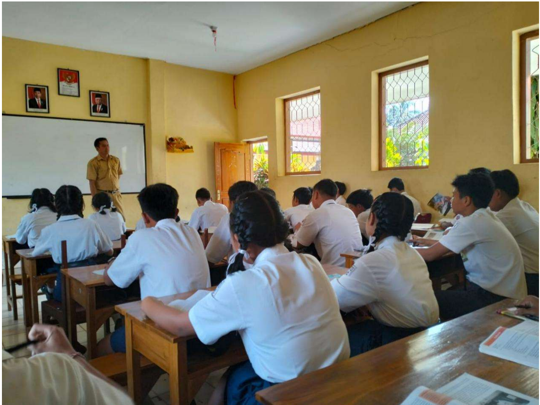
Proses berlangsungnya belajar mengajar