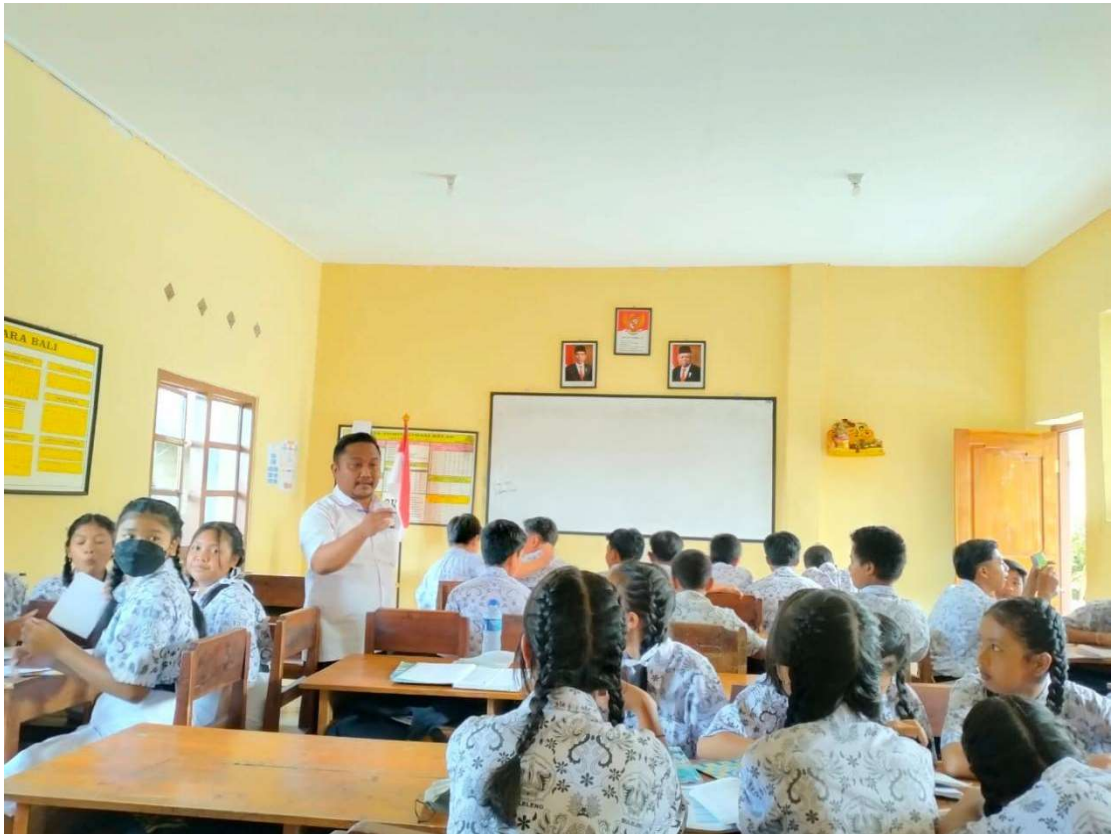
Proses berlangsungnya belajar mengajar