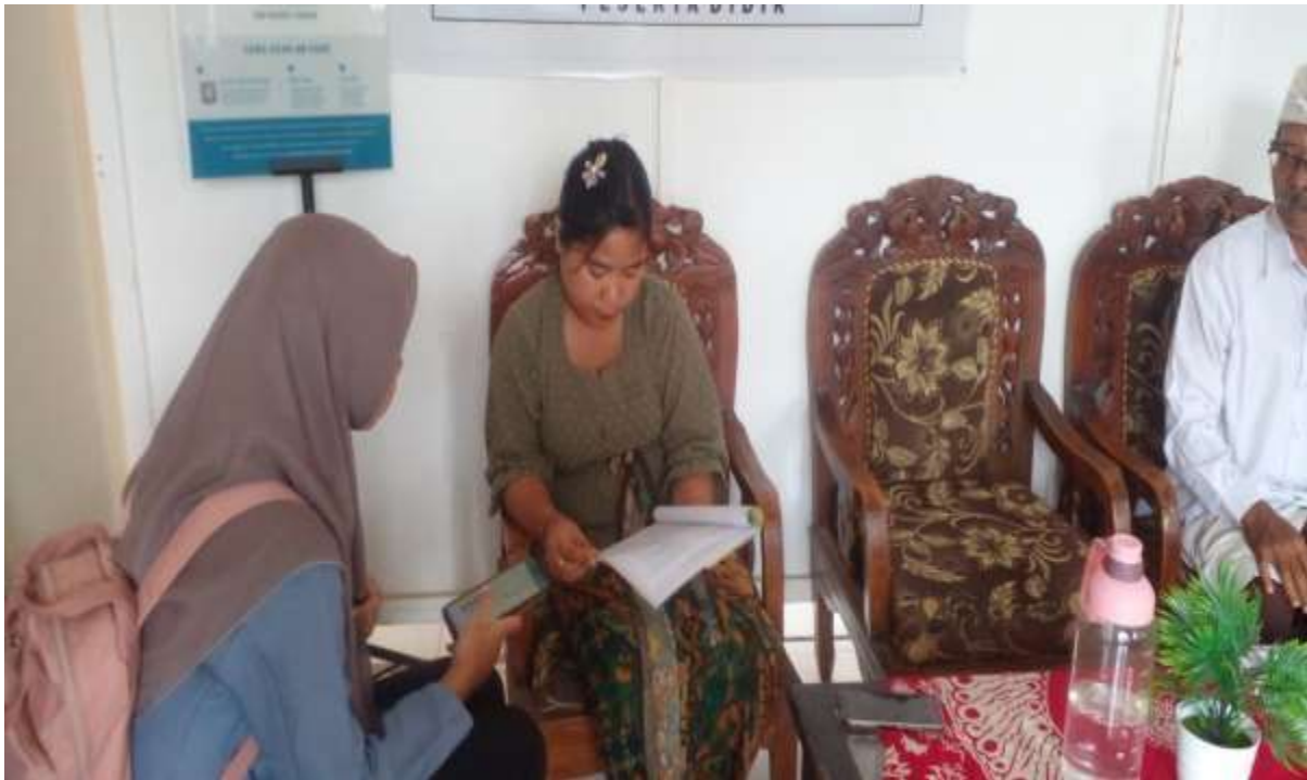
Wawancara Dengan Guru Bimbingan Konseling (BK)