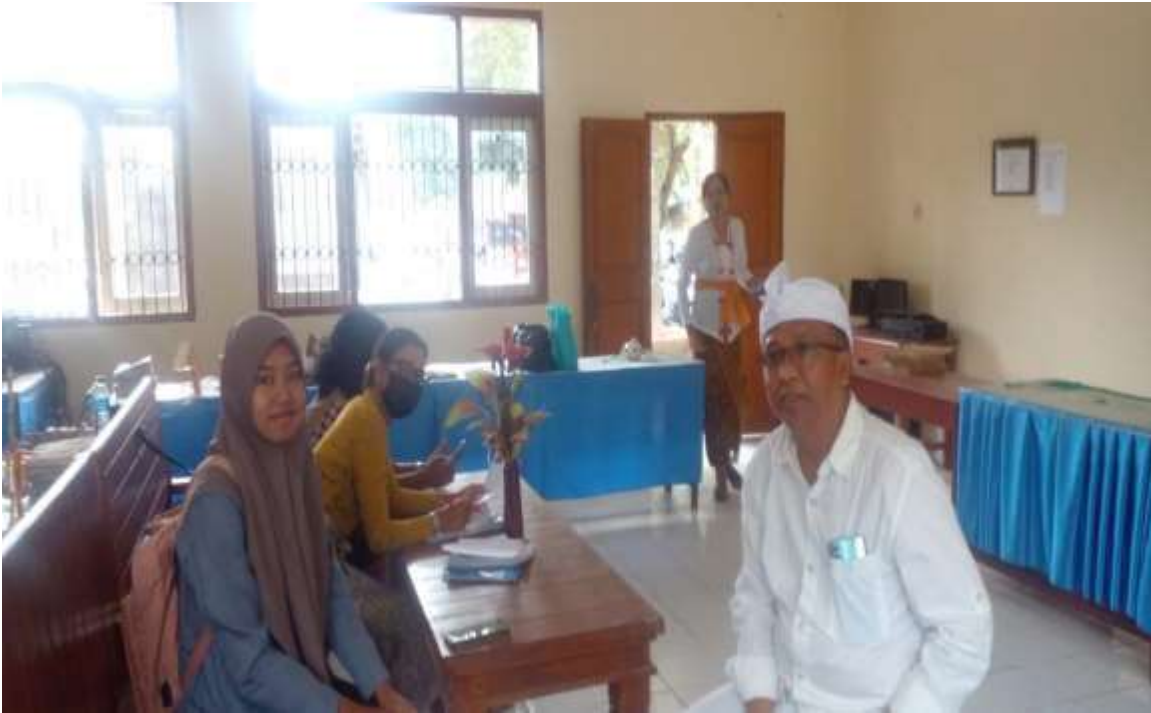
Wawancara Dengan Guru Pendidikan Pancasila dan Kewarganegaraan