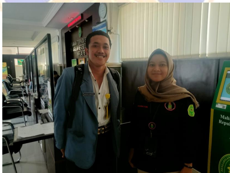
Lampiran 03. Dokumentasi Kegiatan