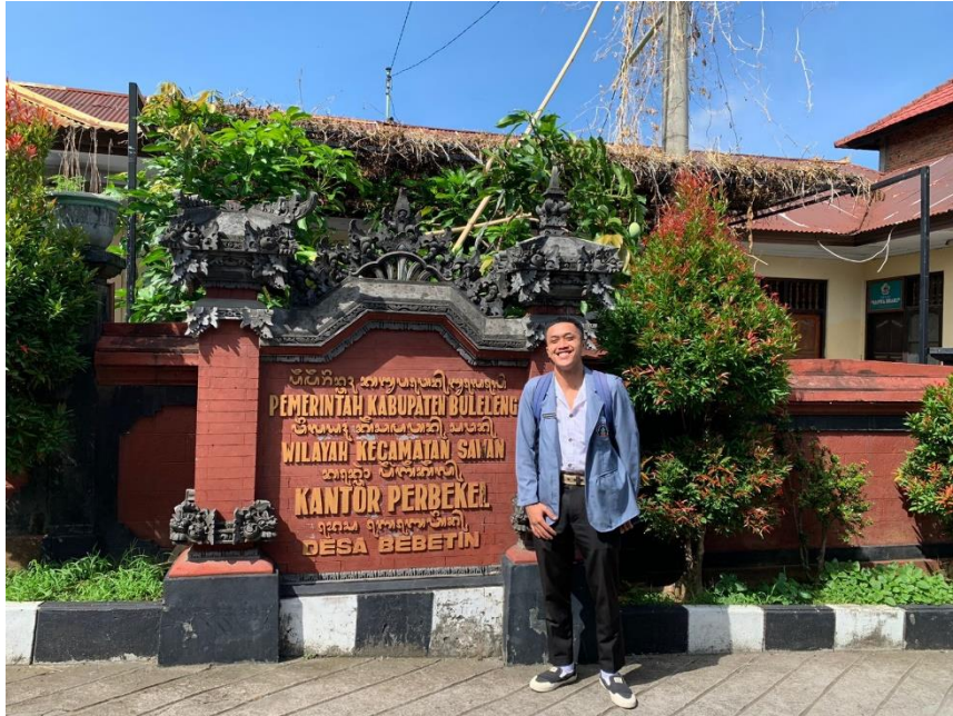
Dokumentasi Desa Bebetin