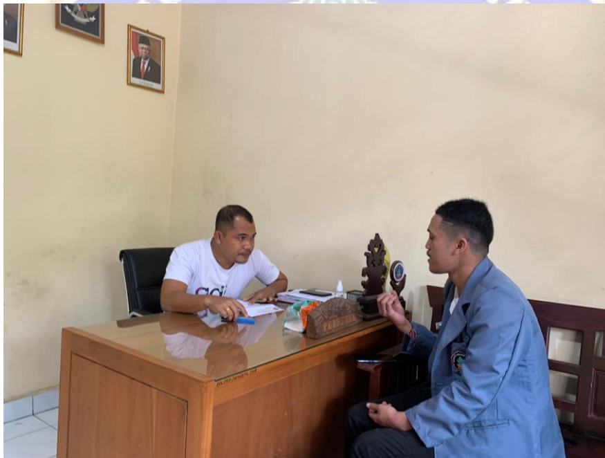
Dokumentasi Dengan Kepala Desa Bebetin