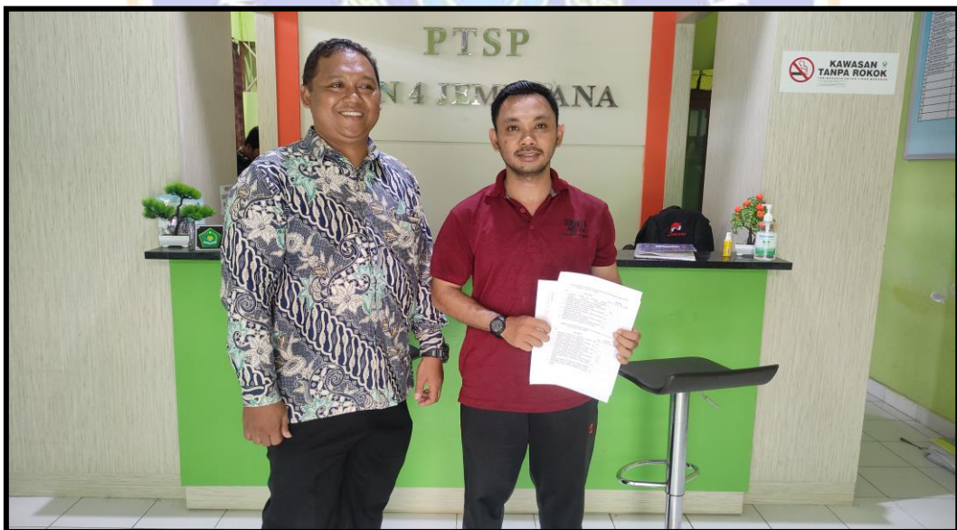
Pengisian Angket Guru PJOK MIN 4 Jembrana