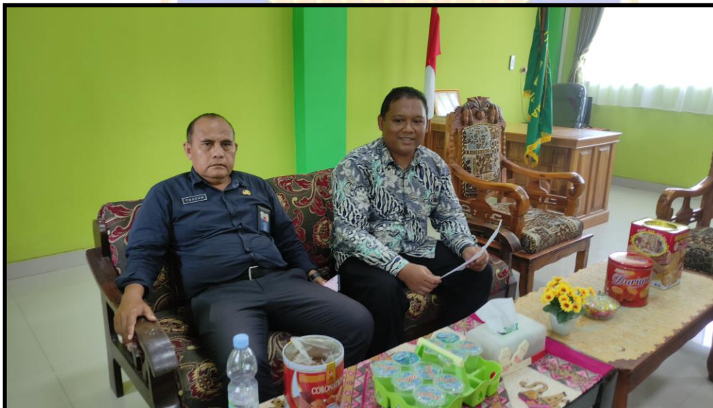
Pengisian Angket Guru PJOK MIN 7 Jembrana