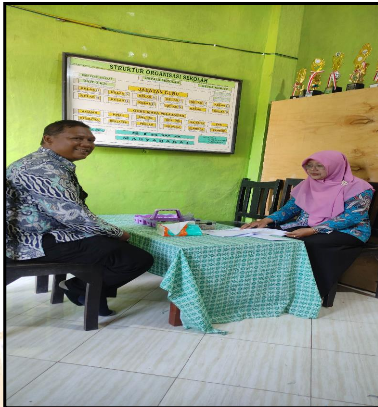
Pengisian Angket Guru PJOK MI. Mambaus Sholinin Pengambangan Negara