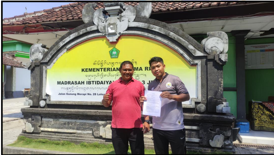
Pengisian Angket Guru PJOK MIN 3 Jemberana