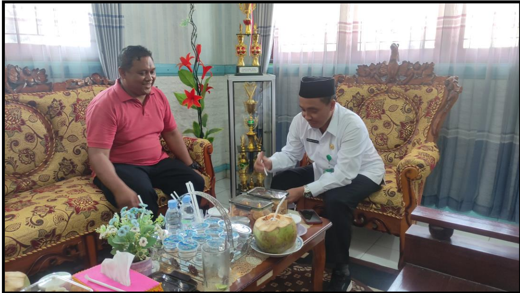
Dokumentasi permohonan izin kepada Kepala MIN 3 Jembrana