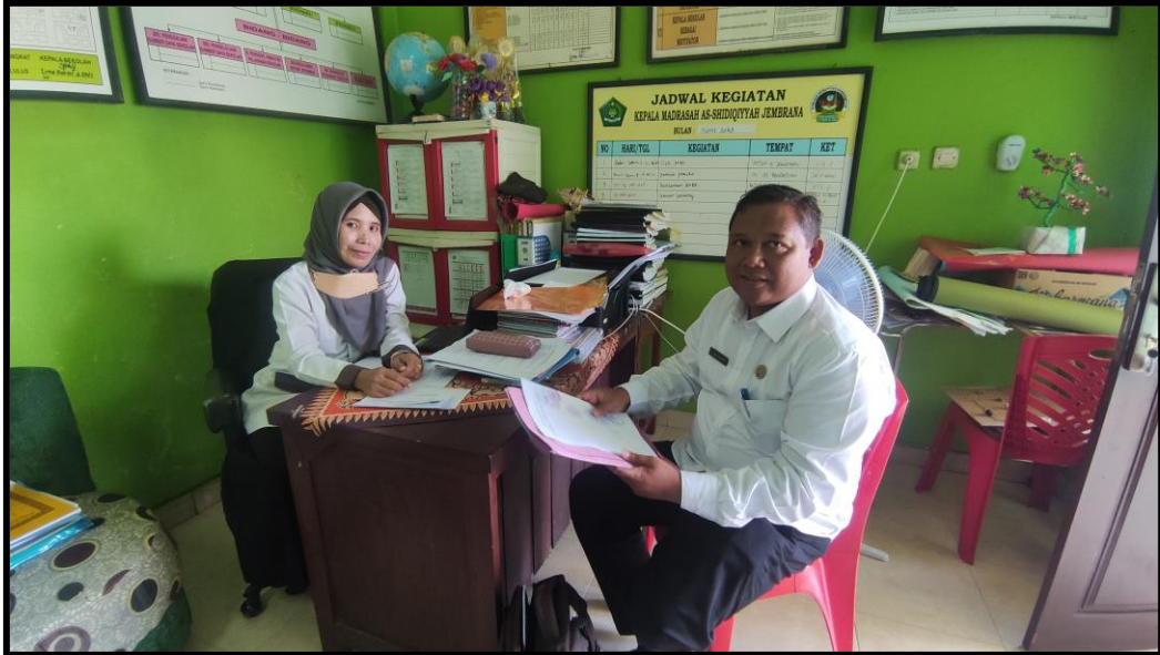
Pengisian Angket Guru PJOK MI. Al Mustaqim Negara