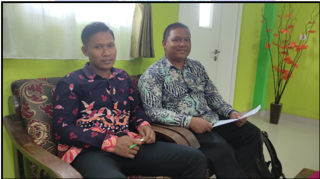
Pengisian Angket Guru PJOK MI. Fajar Nusantara Negara