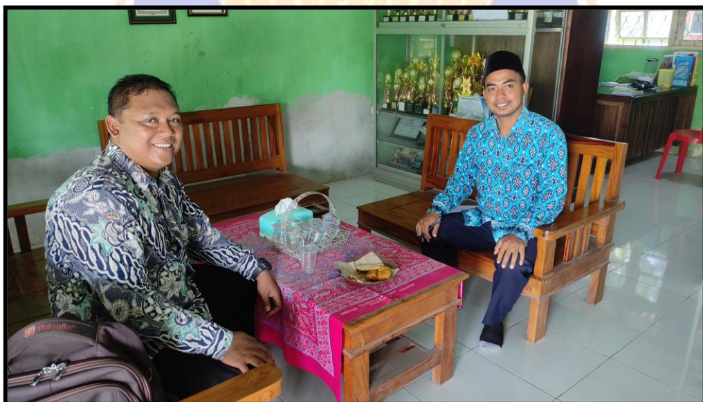
Pengisian Angket Guru PJOK MI. Darussalam Pengambangan Negara