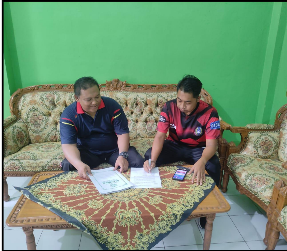
Pengisian Angket Guru PJOK MIN 6 Jembrana