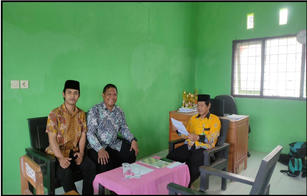
Pengisian Angket Guru PJOK MI. Al Maymun Negara