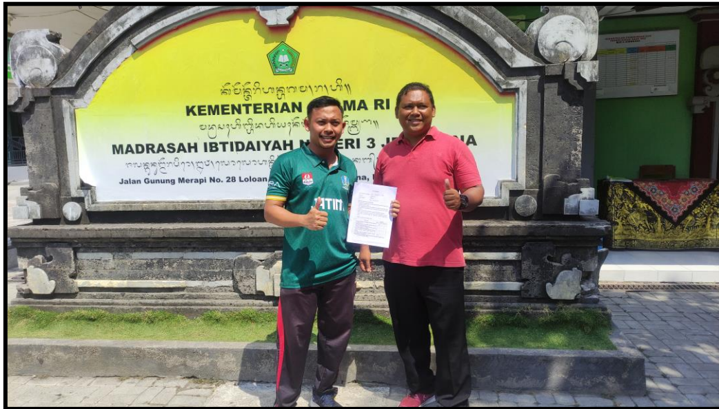
Pengisian Angket Guru PJOK MIN 3 Jemberana