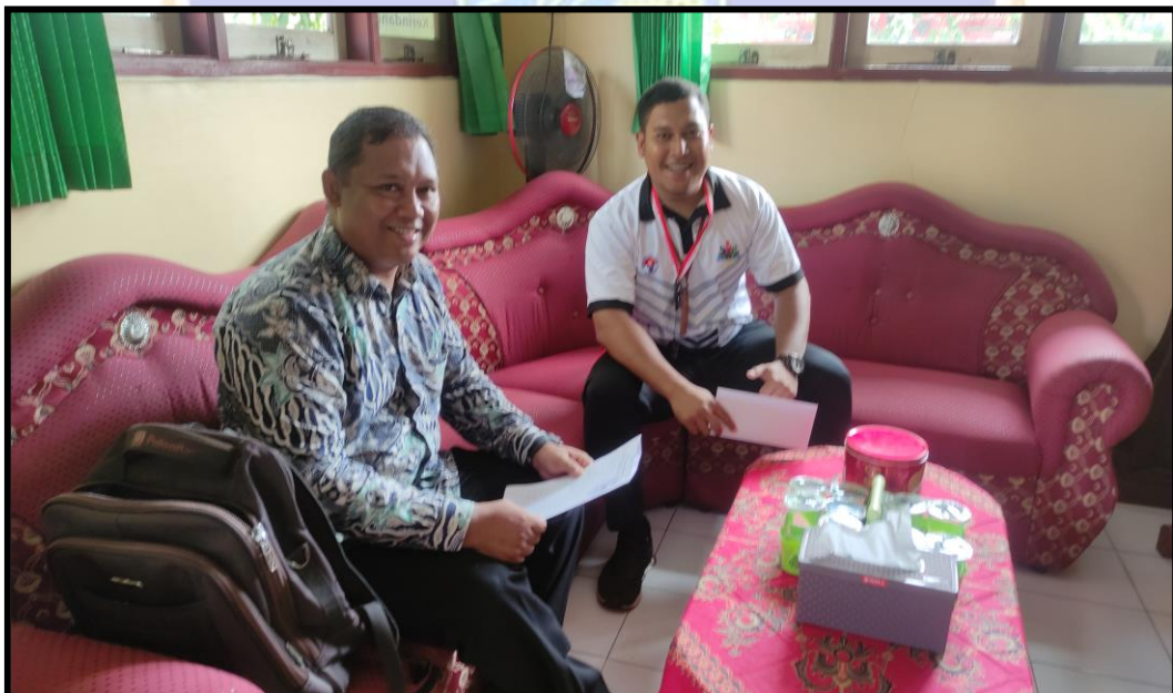
Pengisian Angket Guru PJOK MI. Mujahidin Loloan Barat Negara