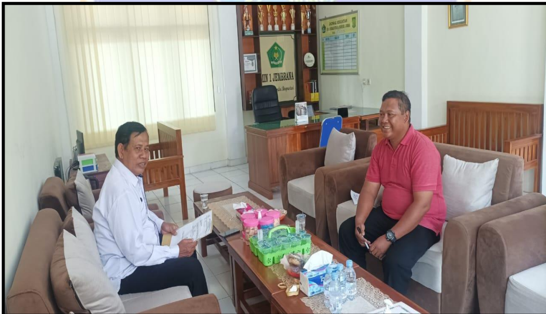
Dokumentasi permohonan ijin kepada Kepala MIN 1 Jembrana