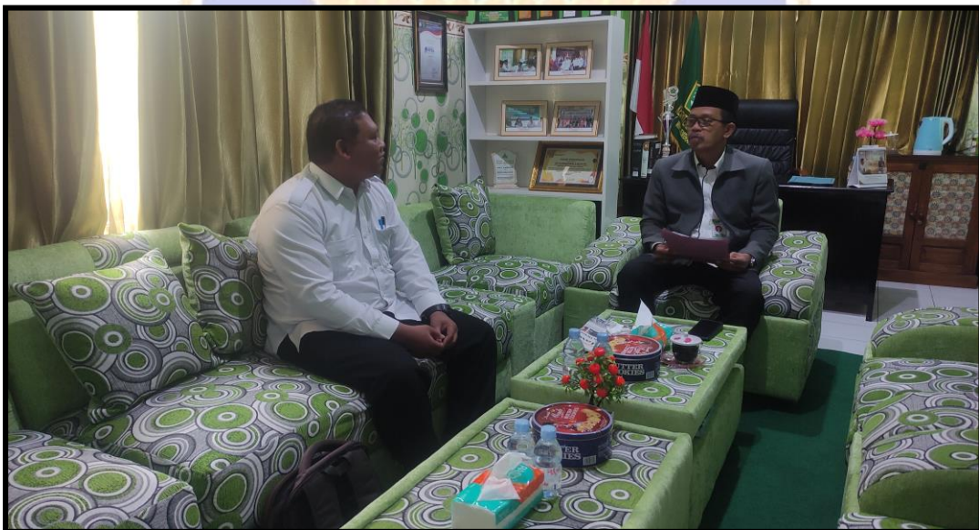
Dokumentasi permohonan izin kepada Kepala MIN 5 Jemberana