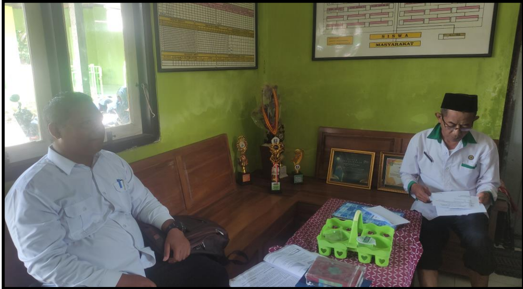
Pengisian Angket Guru PJOK MI. Nurul Ikhlas Pebuahan Negara