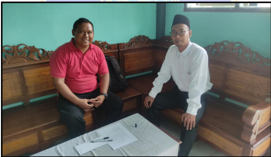
Pengisian Angket Guru PJOK MI. Miftahul Ulum Melaya