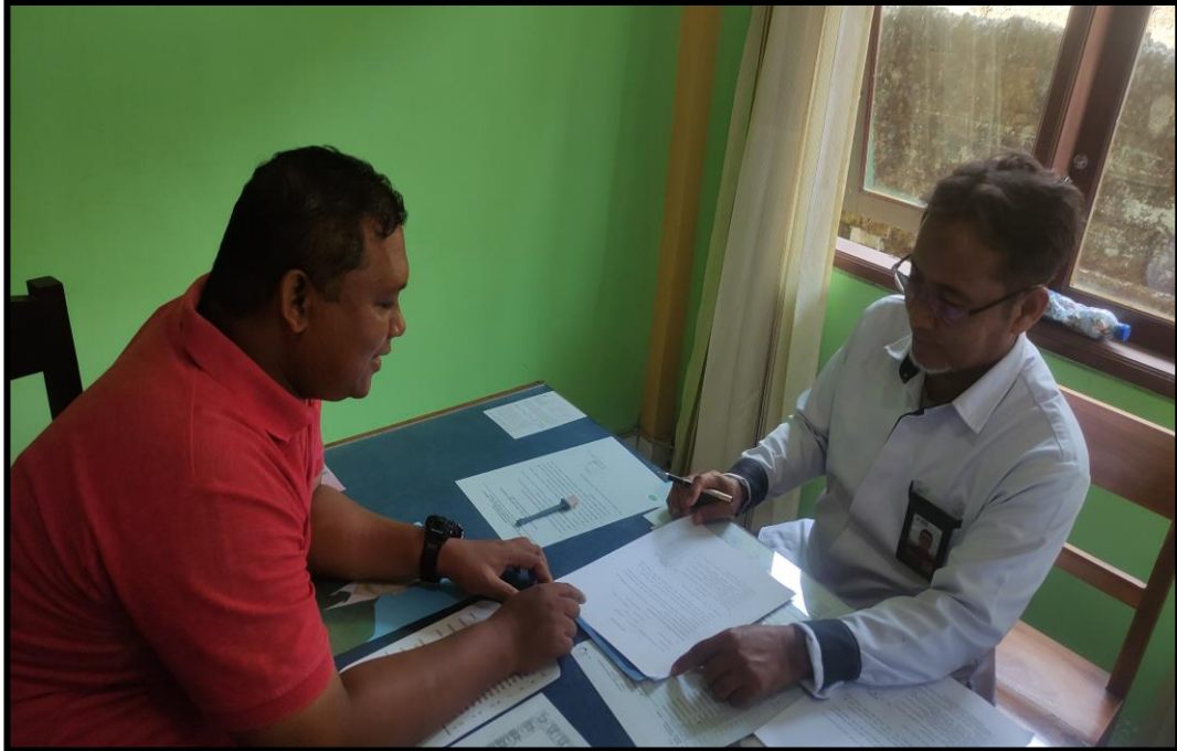
Pengisian Angket Guru PJOK MIN 1 Jembrana