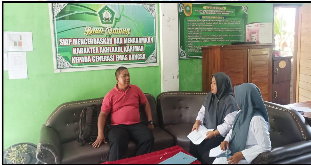
Pengisian Angket Guru PJOK MI. Nurussalam Medewi