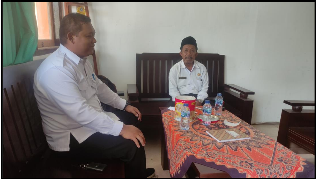
Pengisian Angket Guru PJOK MI. Al Fatah Melaya