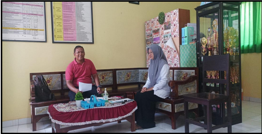
Pengisian Angket Guru PJOK MI. Nurul Islam Pulukan