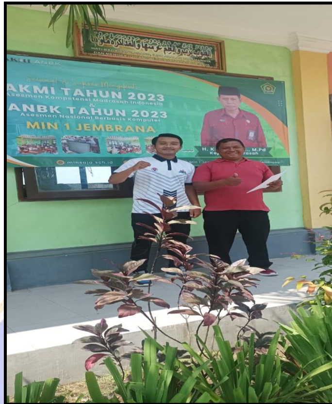
Pengisian Angket Guru PJOK MIN 5 Jemberana