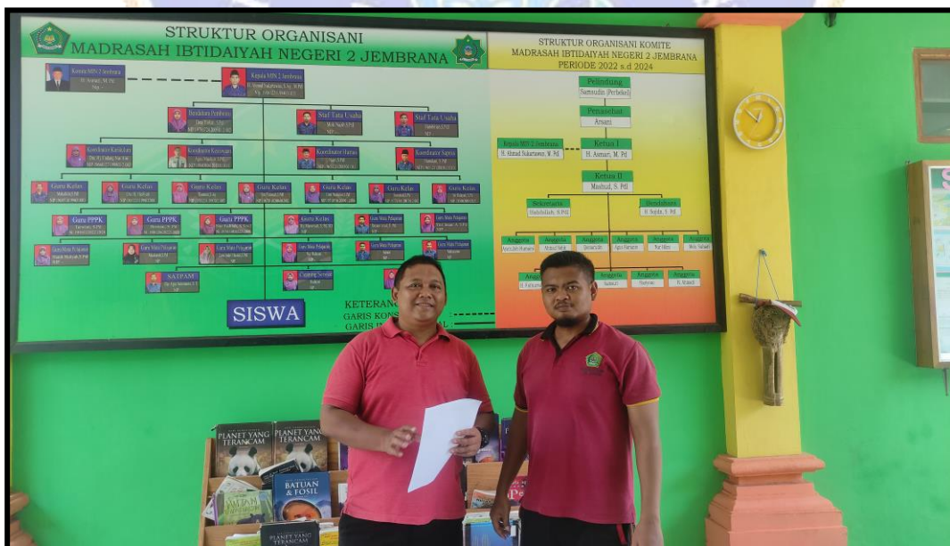
Pengisian Angket Guru PJOK MIN 2 Jemberana