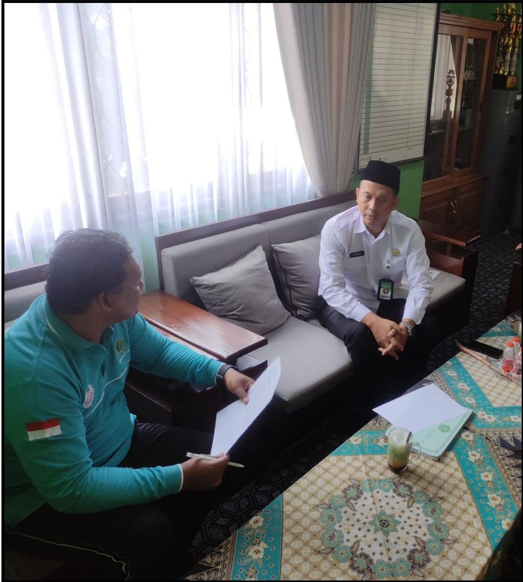
Dokumentasi wawancara dengan Kasi Pendidikan Islam