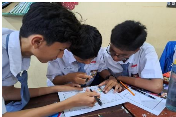
Gambar 4. 1