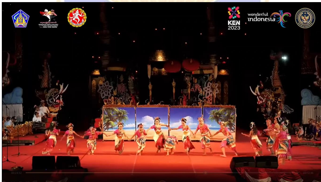
Dok. Plalian Ngarot ring Pesta Kesenian Bali 2023