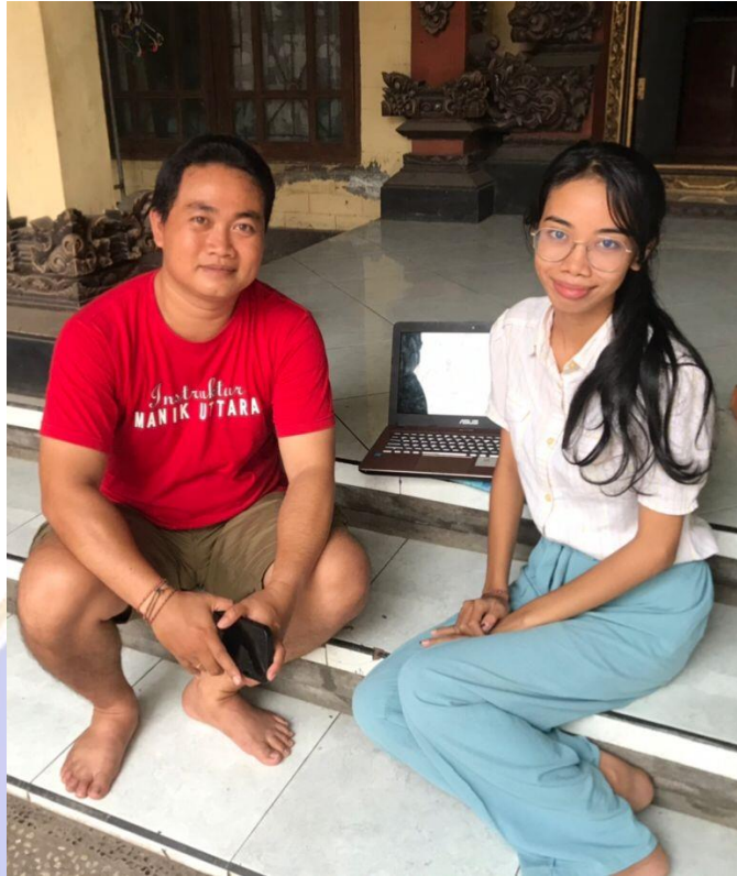
Dok. Sadu Wicara sareng Pangawi Plalian Ngarot