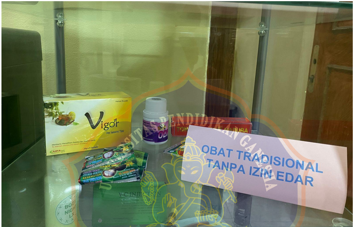
Obat Tradisional Tanpa Izin Edar