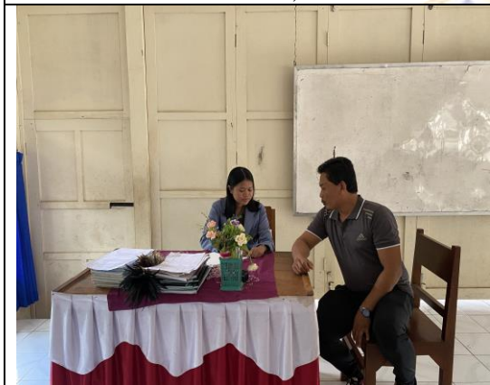
(Pelaksanaan observasi di SD Negeri 3 Bebetin)