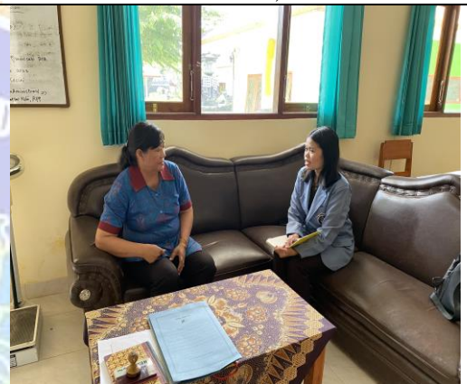
(Pelaksanaan observasi di SD Negeri 4 Bebetin)