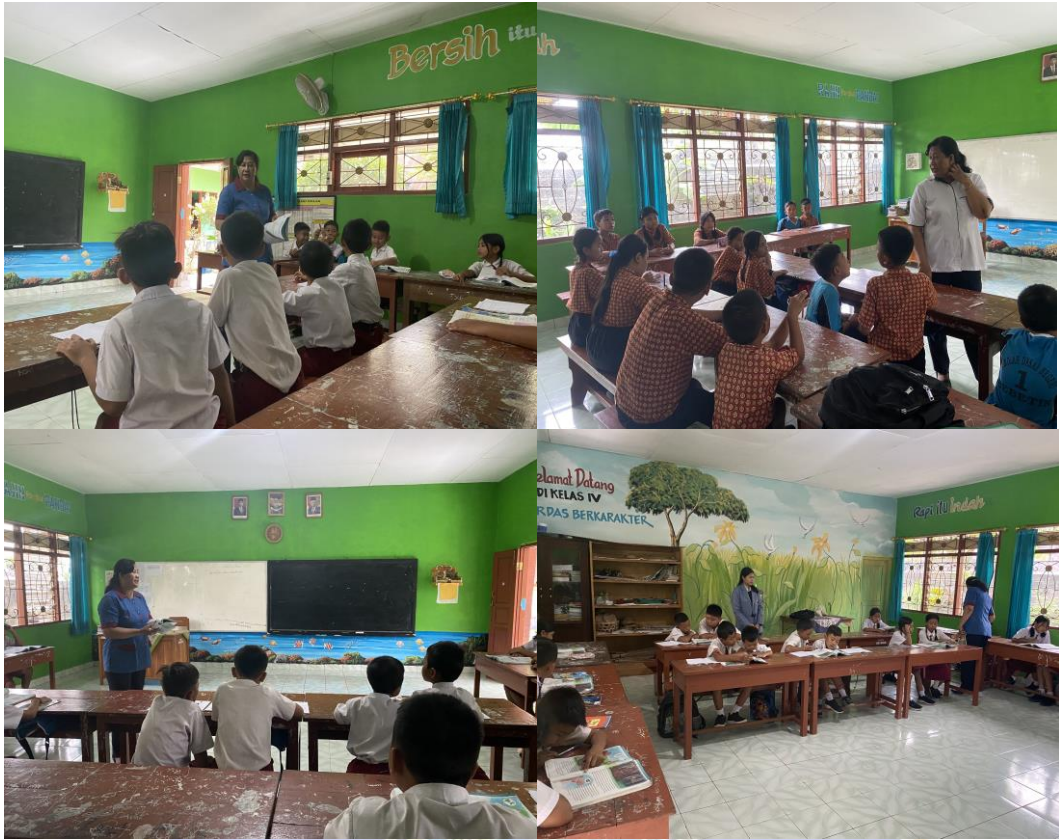
(Pelaksanaan proses pembelajaran dengan menerapkan model pembelajaran konvensional di kelas kontrol)