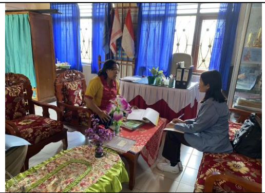
(Pelaksanaan observasi di SD Negeri 2 Bebetin)