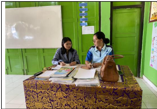
(Pelaksanaan observasi di SD Negeri 1 Bebetin)