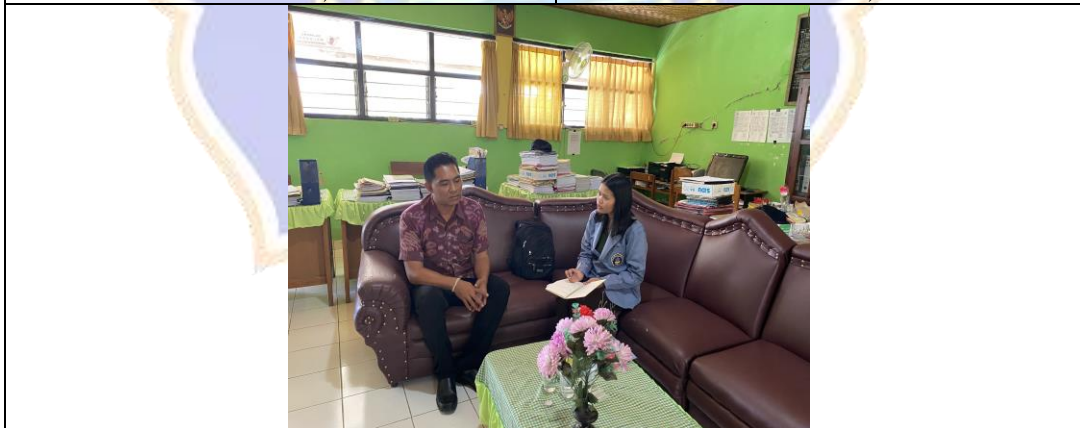
(Pelaksanaan observasi di SD Negeri 5 Bebetin)