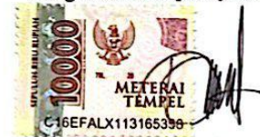
Putu Diana Puspita