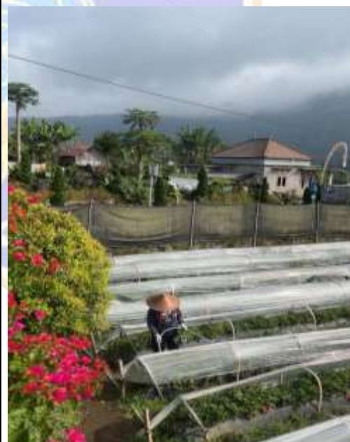
Proses petani merawat kebun stroberi secara rutin