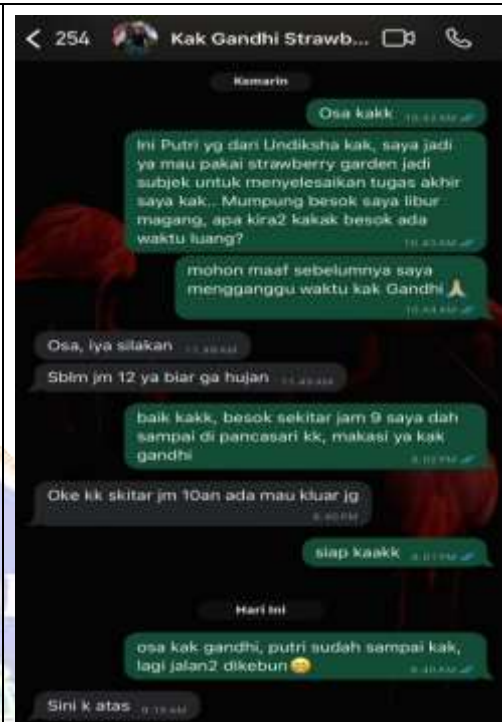
Proses observasi dan wawancara di Hidden Strawberry Garden