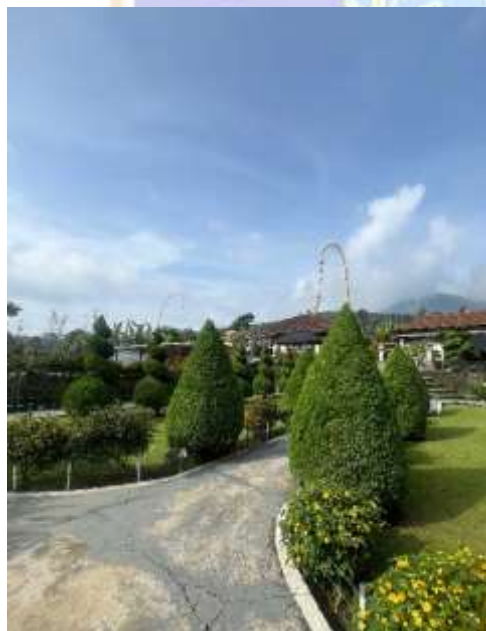
Salah satu spot kebun yang Instagramable