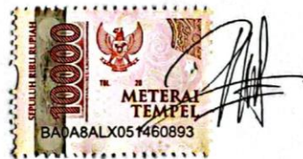
Ni Putu Intan Pradnyani

Singaraja, 13 Mei 2024 Yang membuat pernyataan,