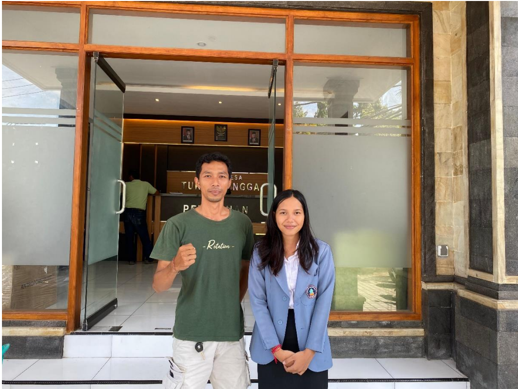
Wawancara Bersama Masyarakat Desa Tukadmungga.