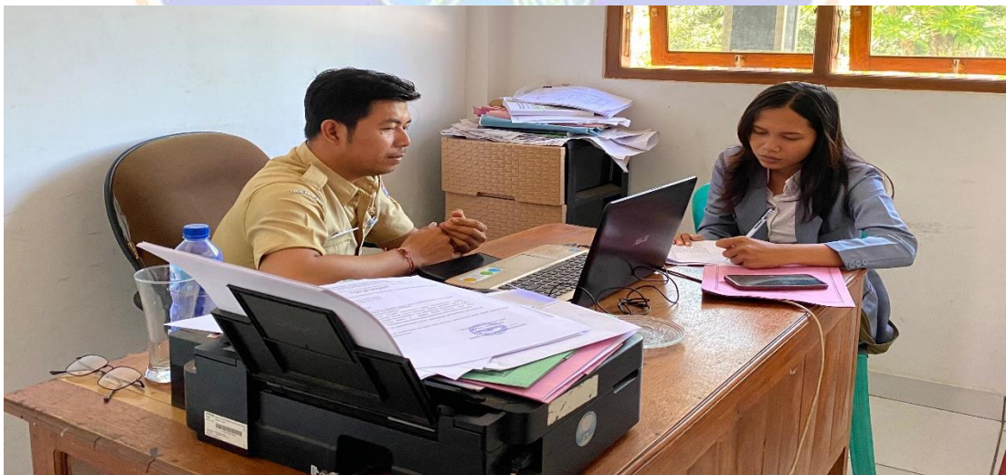
Wawancara Bersama Ketua Relawan Anti Narkoba Desa Tukad Mungga.