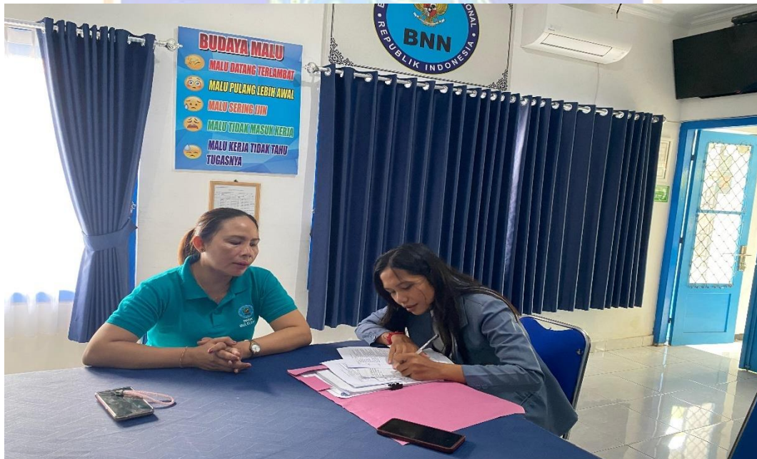
Wawancara Bersama Sub Koordinator Seksi Rehabilitasi Badan Narkotika Nasional Kabupaten Buleleng