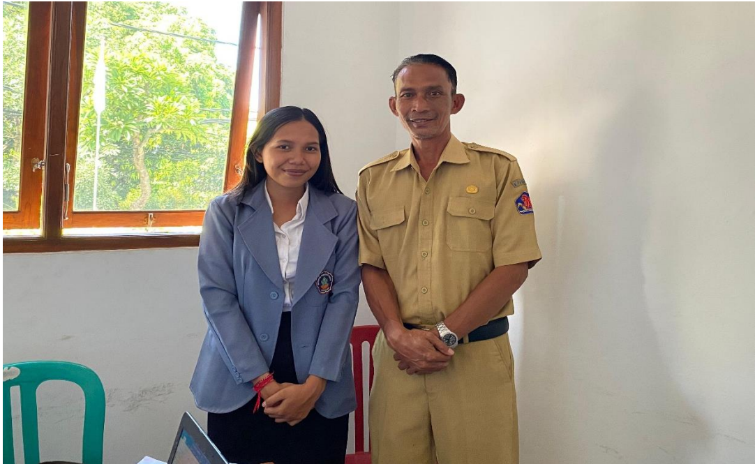
Wawancara Bersama Anggota Relawan Anti Narkoba Desa Tukad Mungga.