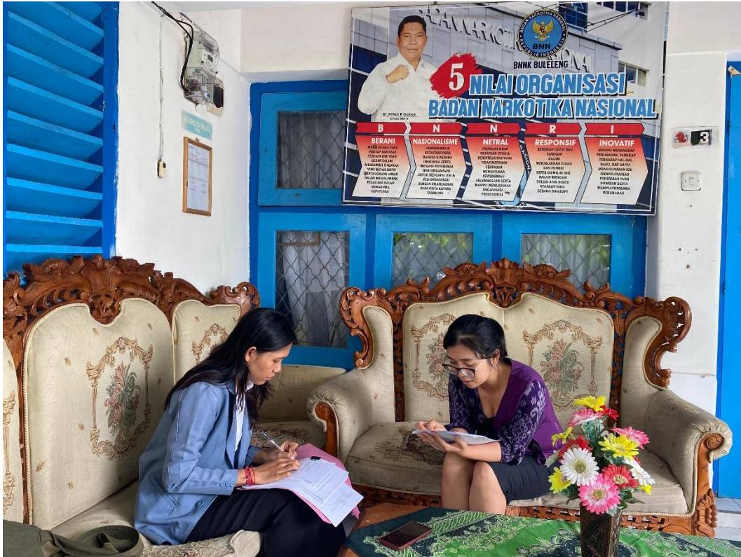
Wawancara Bersama Penyuluh Narkoba Ahli Pertama Badan Narkotika Nasional Kabupaten Buleleng.