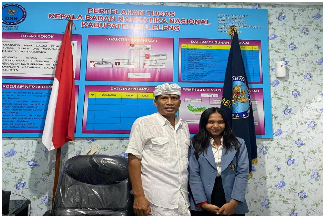
Wawancara Bersama Kepala Badan Narkotika Nasional Kabupaten Buleleng.