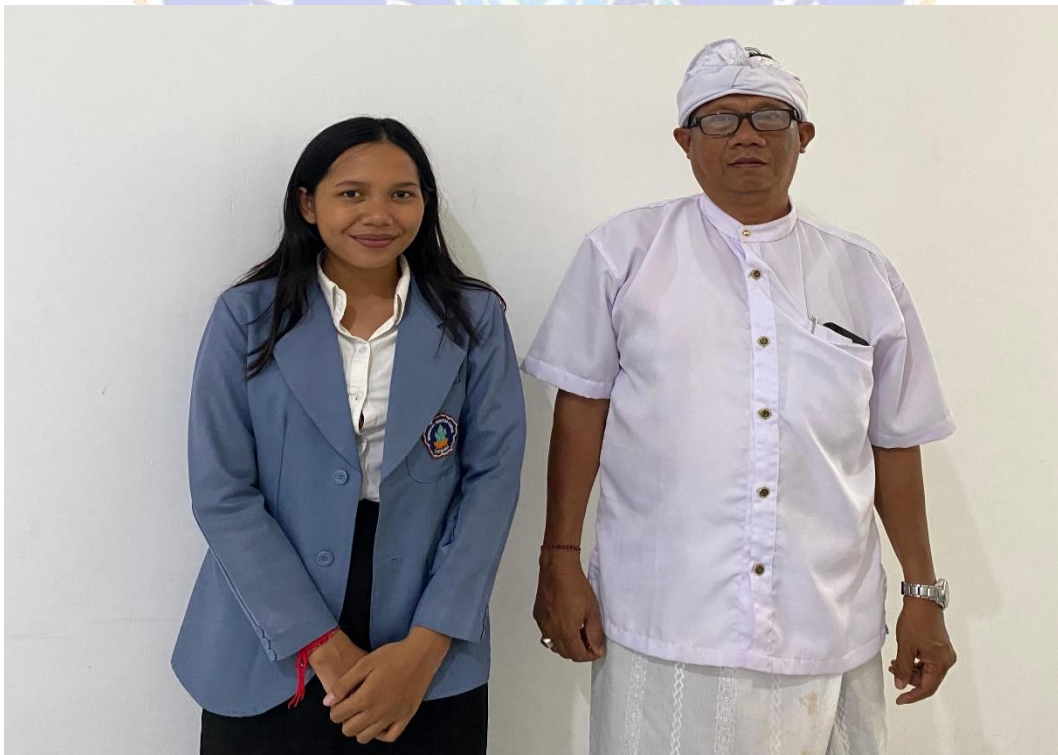
Wawancara Bersama Anggota Relawan Anti Narkoba Desa Tukadmungga.