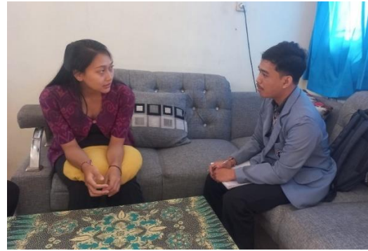
Pemberian Surat Sekaligus Pelaksanaan Wawancara Kepada Guru di SD Negeri 2 Kawan