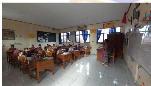
Pelaksanaan Pretest di SD Negeri 2 Kawan.