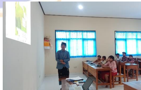
Pemberian Materi, Media Serta Uji Coba Perorangan dan Kelompok Kecil.