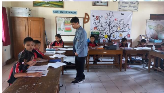
Pelaksanaan Uji Coba Instrumen di SD Negeri 3 Bebalang