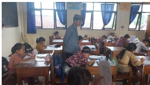
Pelaksanaan Posttest di SD Negeri 2 Kawan