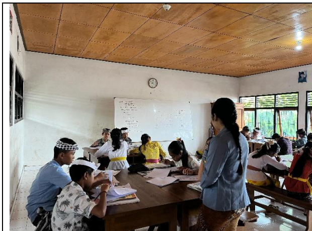
Pengisian Kuisisioner siswa kelas VI