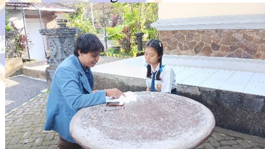
Wawancara dengan Siswa 5/SW5