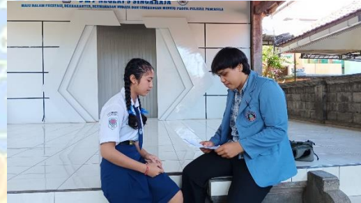
Wawancara dengan Siswa 3/SW3