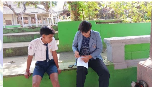
Wawancara dengan Siswa 1/SW1