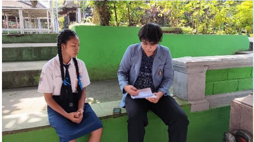
Wawancara dengan Siswa 2/SW2