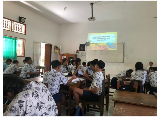
Observasi di dalam Kelas