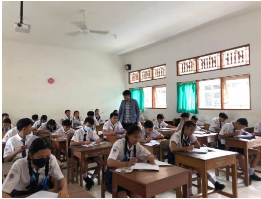
Pemberian Angket ke Siswa