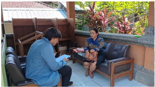
Wawancara dengan Guru IPA/G1