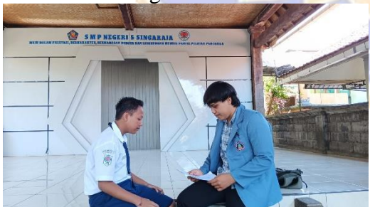
Wawancara dengan Siswa 4/SW4