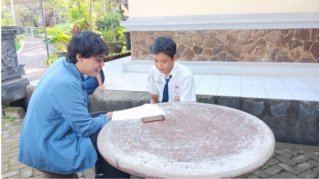
Wawancara dengan Siswa 6/SW6