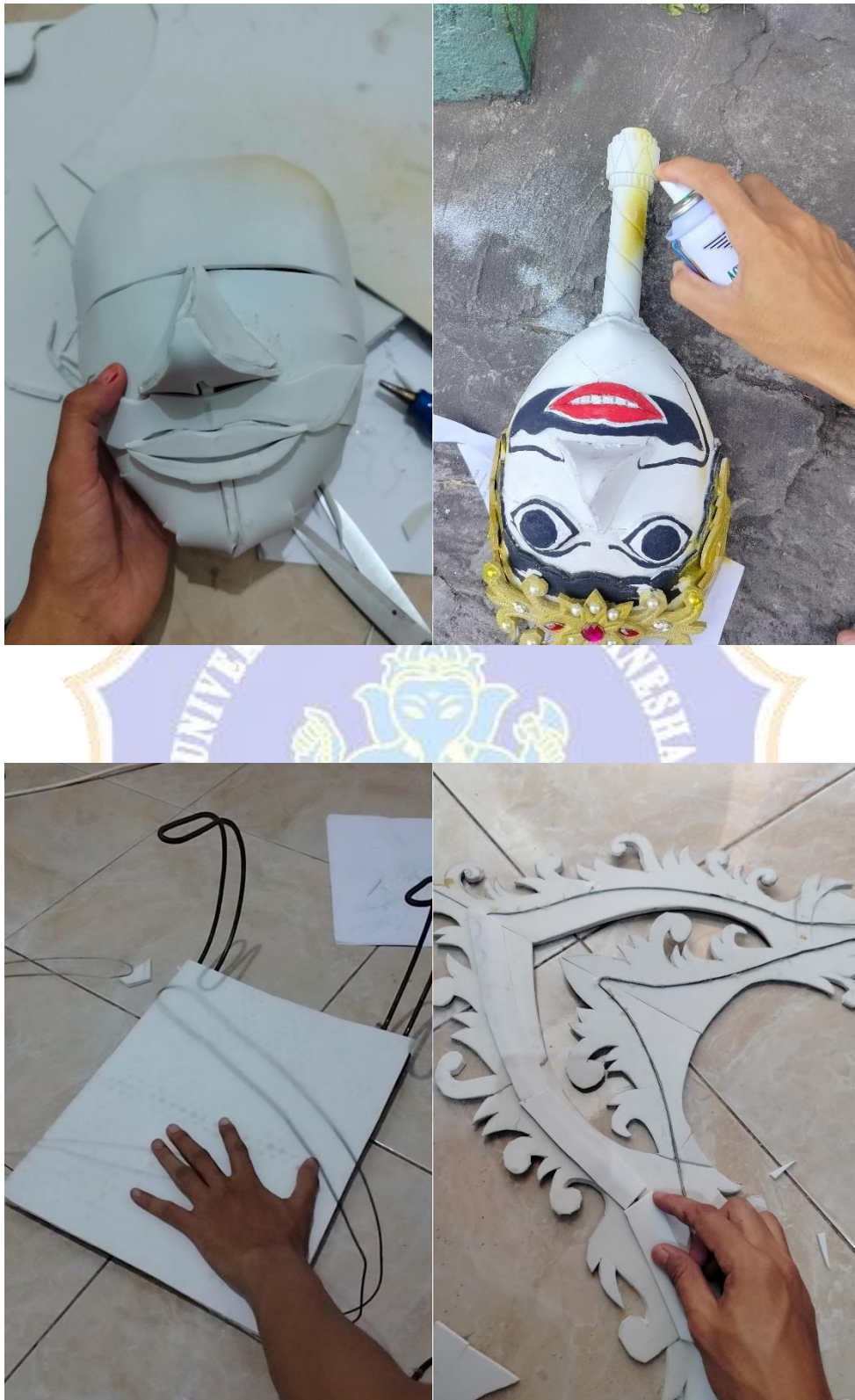
Lampiran 2 Proses pembuatan kostum karnaval