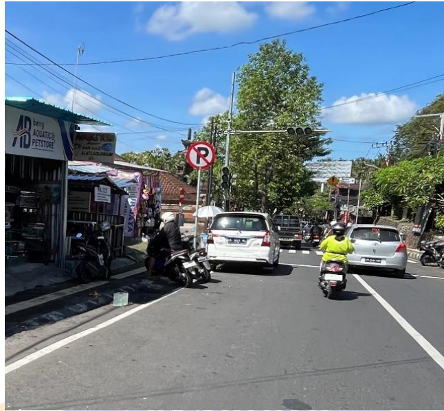
Foto pelanggaran parkir kendaraan menggunakan sebagian ruas jalan di kawasan bebas parkir, terjadi di Jalan Gajah Mada Tabanan, sebelah utara Pasar Tradisional Tabanan.