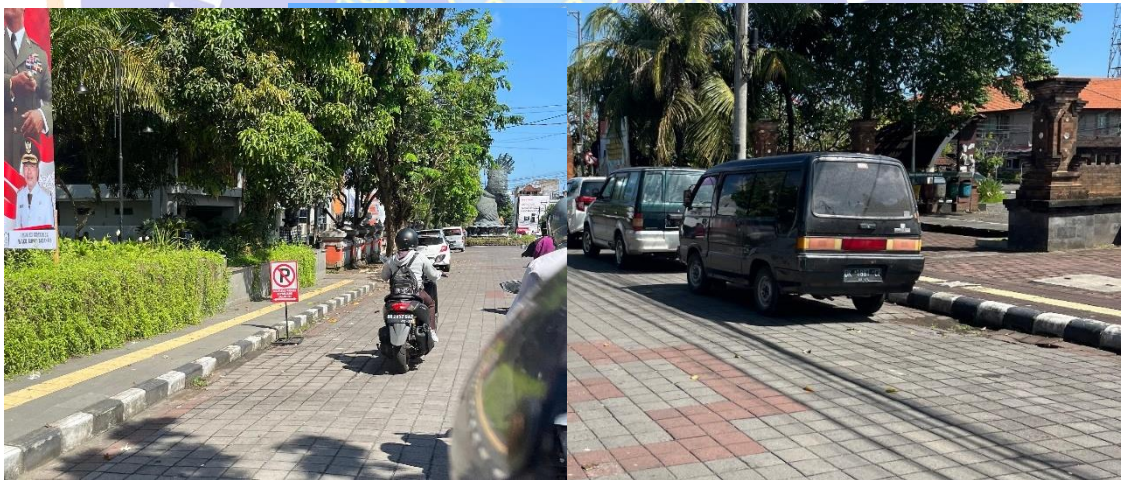
Foto pelanggaran parkir kendaraan menggunakan sebagian ruas jalan di kawasan bebas parkir, terjadi di Jalan Gunung Agung, sebelah Timur Gedung Kesenian I Ketut Maria/Gedung Mario Tabanan.

Foto pelanggaran parkir kendaraan menggunakan sebagian ruas jalan di kawasan bebas parkir, terjadi di Jalan Gajah Mada Tabanan, sebelah utara Pasar Tradisional Tabanan.