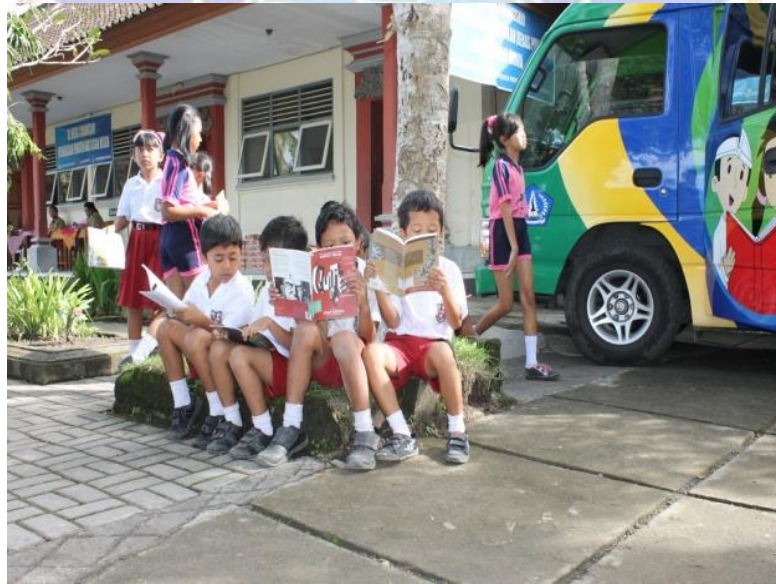
Gambar 12 Gerakan Literasi Siswa SD Negeri 1 Mengwi