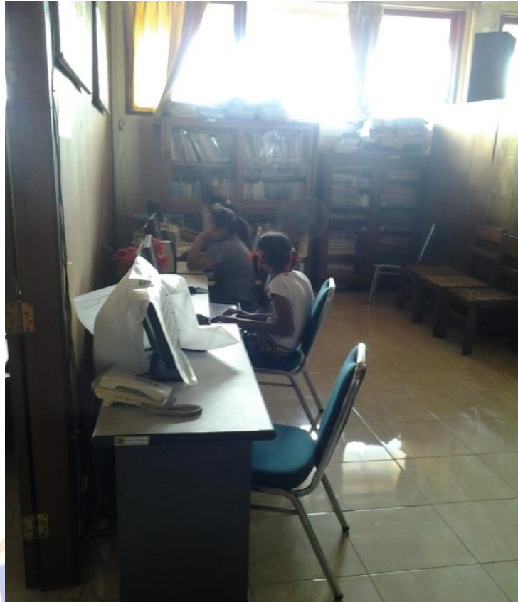
Gambar 11 Perpustakaan Sekolah