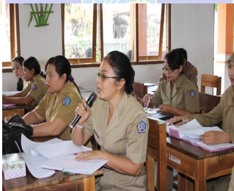
Gambar 10 Sosialisasi Pengelolaan Perpustakaan Sekolah