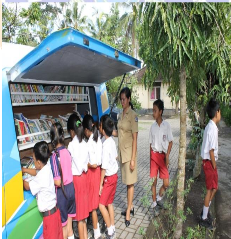
Gambar 08. Kunjungan perpustakaan Keliling ke SD