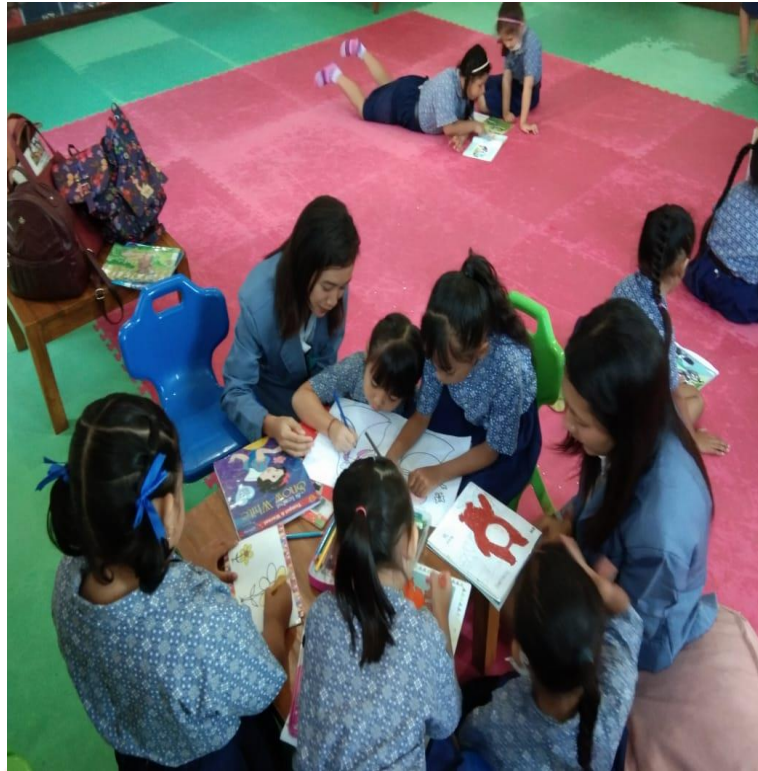
Gambar 03.Layanan Anak