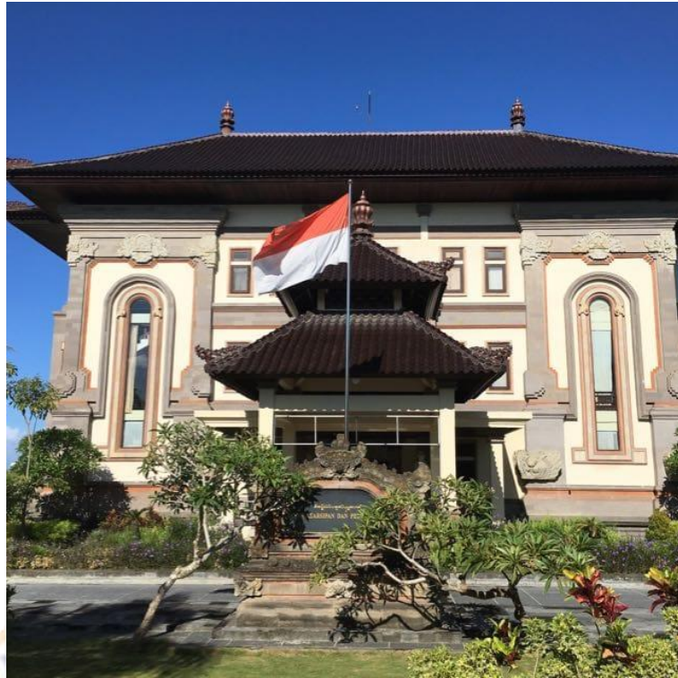
Gambar 01. Tampak Depan Gedung Dinas Kearsipan dan Perpustakaan Kabupaten Badung