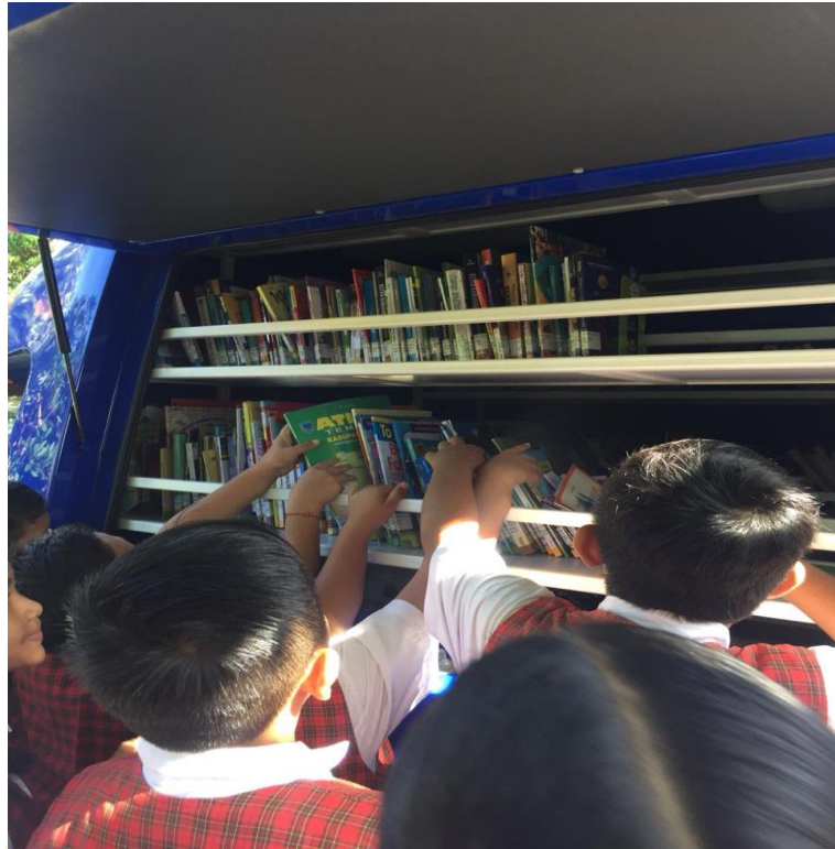
Gambar 05. Layanan Perpustakaan Keliling (sumber: Dokumen Pribadi Wulan, Maret 2020)