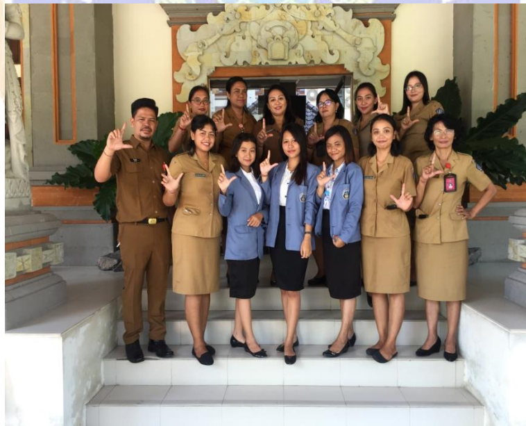
Gambar 13. Foto Bersama dengan pegawai bidang layanan dan pelestarian Perpustakaan Dinas Kearsipan dan Perpustakaan Kabupaten Badung