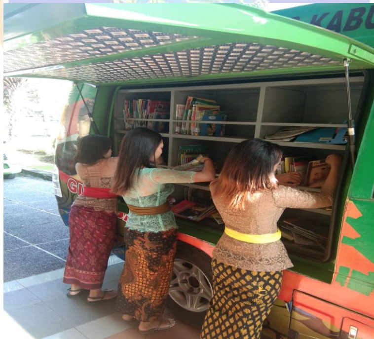
Gambar 06. Sarana dan Koleksi Perpustakaan Keliling