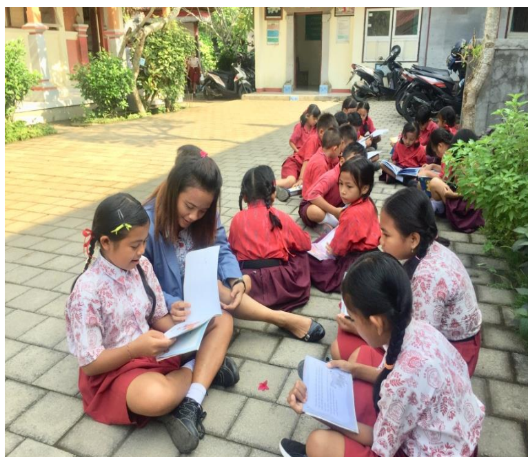
Gambar 09. Kegiatan Melakukan Kunjungan Ke sekolah yang berada di desa Mengwi dan mengajarkan cara melakukan penelusuran informasi.