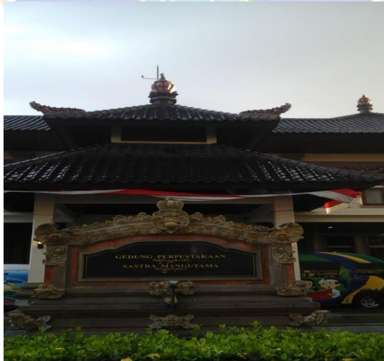
Gambar 02. Tampak Depan Gedung Perpustakaan (Sumber: Dokumen Pribadi Wulan, Maret 2020)