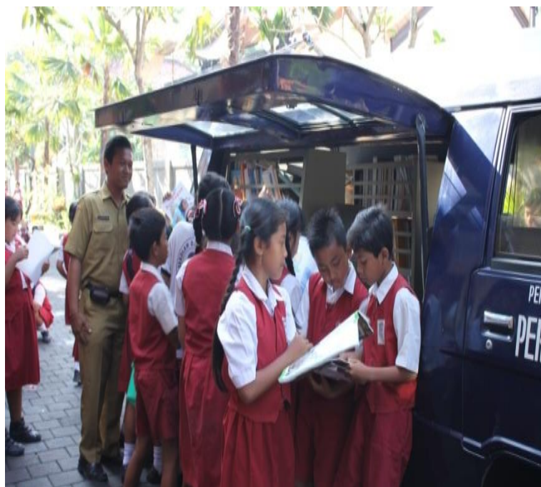
Gambar 07. Tingkat Membaca Siswa semakin Tinggi