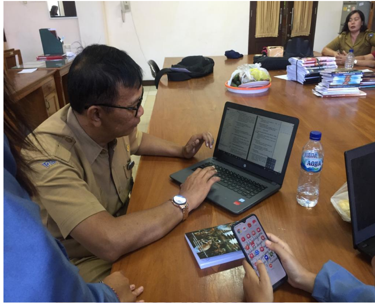
Gambar 13. Salah satu wawancara dengan pustakawan perpustakaan Dinas Kearsipan dan Perpustakaan Kabupaten Badung