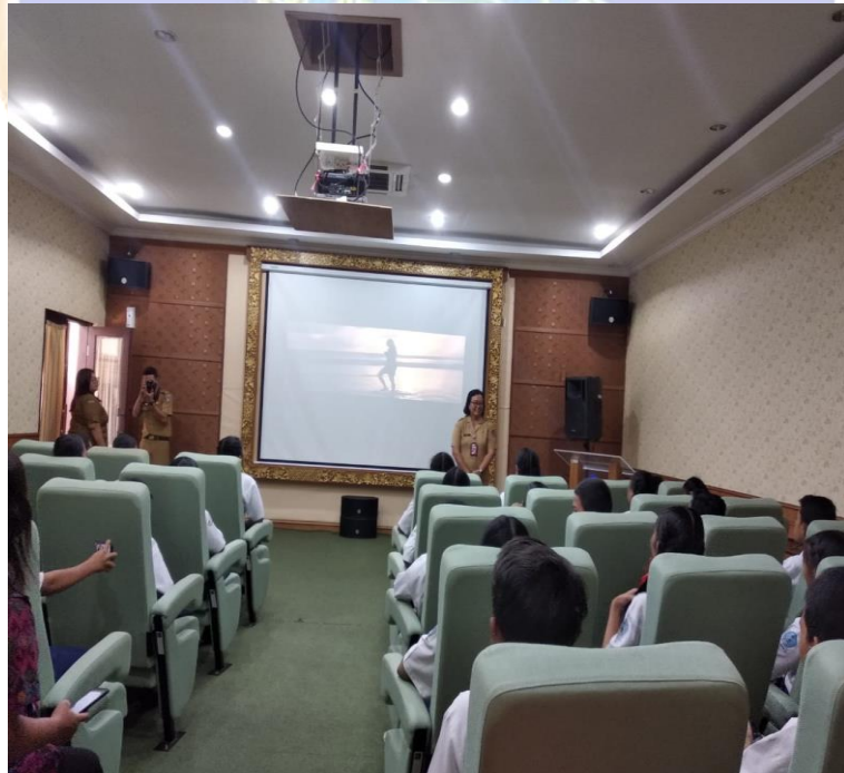
Gambar 04.Layanan Diorama