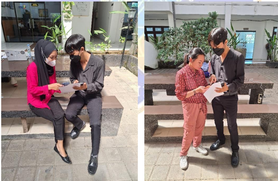
Foto Bersama Responden