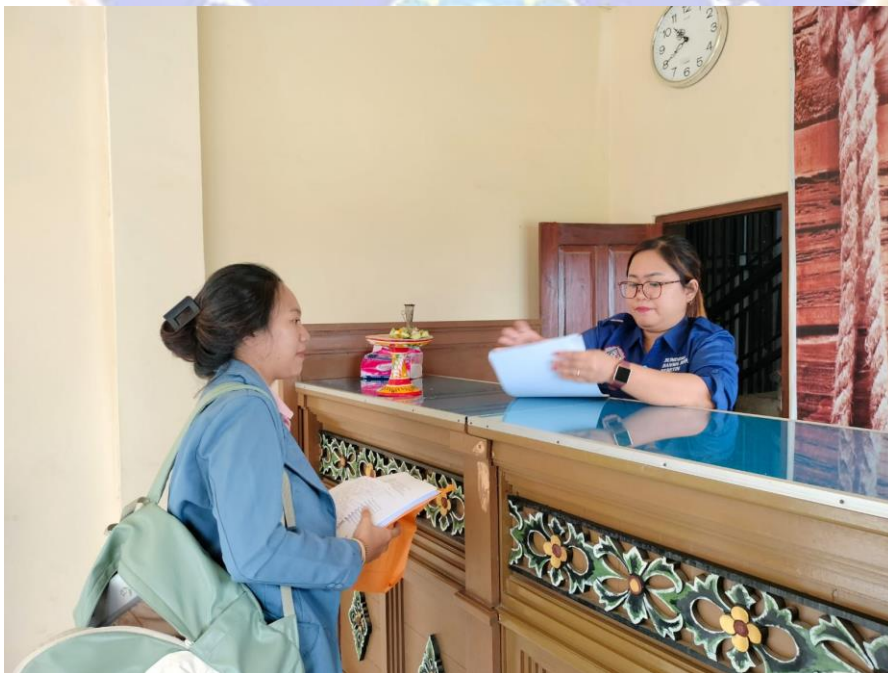
(BUMDes Desa Bebetin, Banwa Bharu)