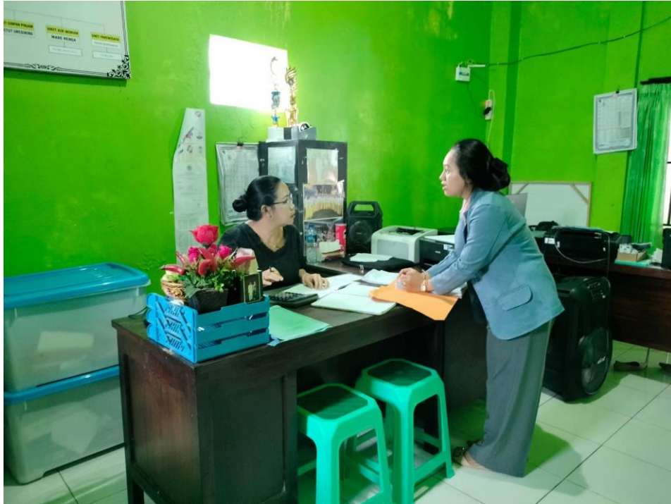
(BUMDes Desa Sekumpul Sekar Bang)