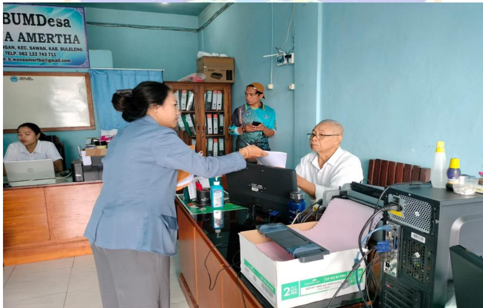
(BUMDes Desa Galungan Wana Amertha)