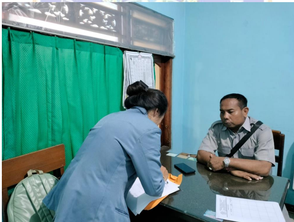
(BUMDes Desa Sangsit, Sidi Amertha)