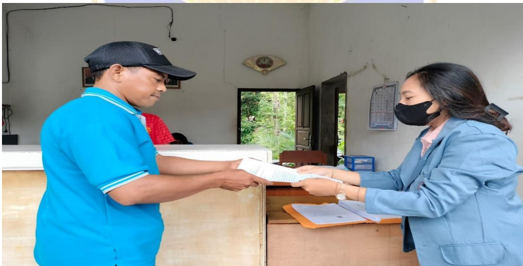
(BumDes Desa Sudaji Muncul Sari Aji)