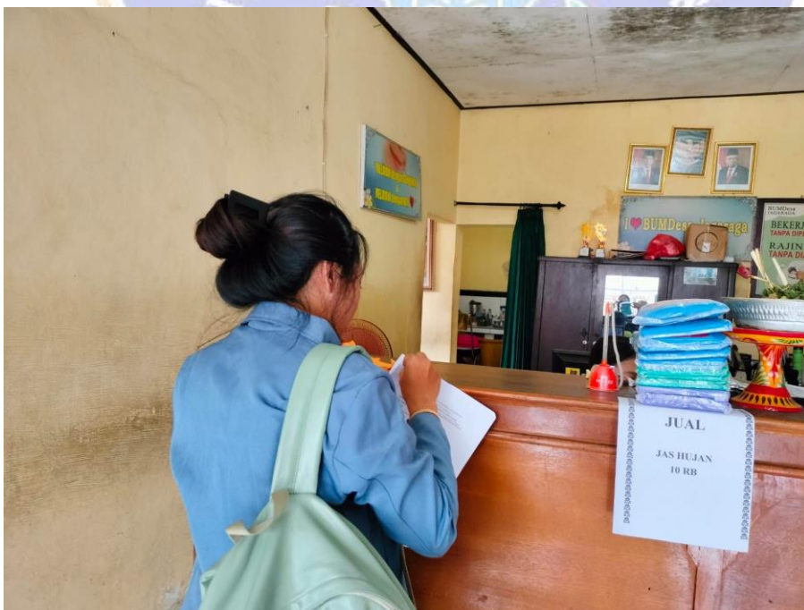
(BUMDes Desa Jagaraga, Suka Pura)