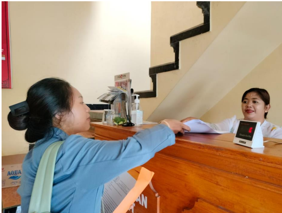
(BUMDes Desa Sawan, Swandesi)