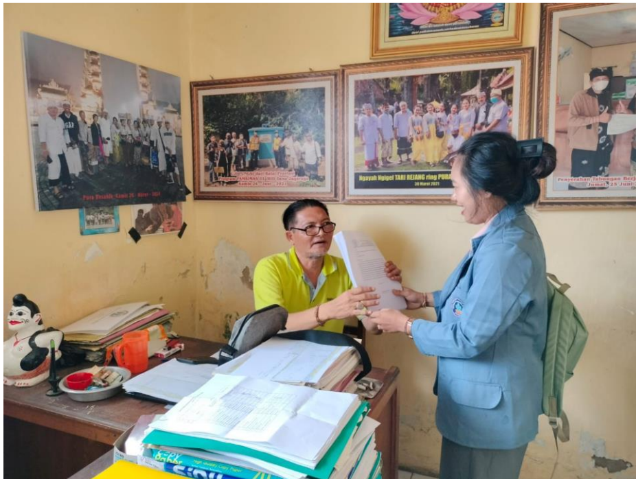
(BUMDes Desa Menyali, Laksadana Menyali)