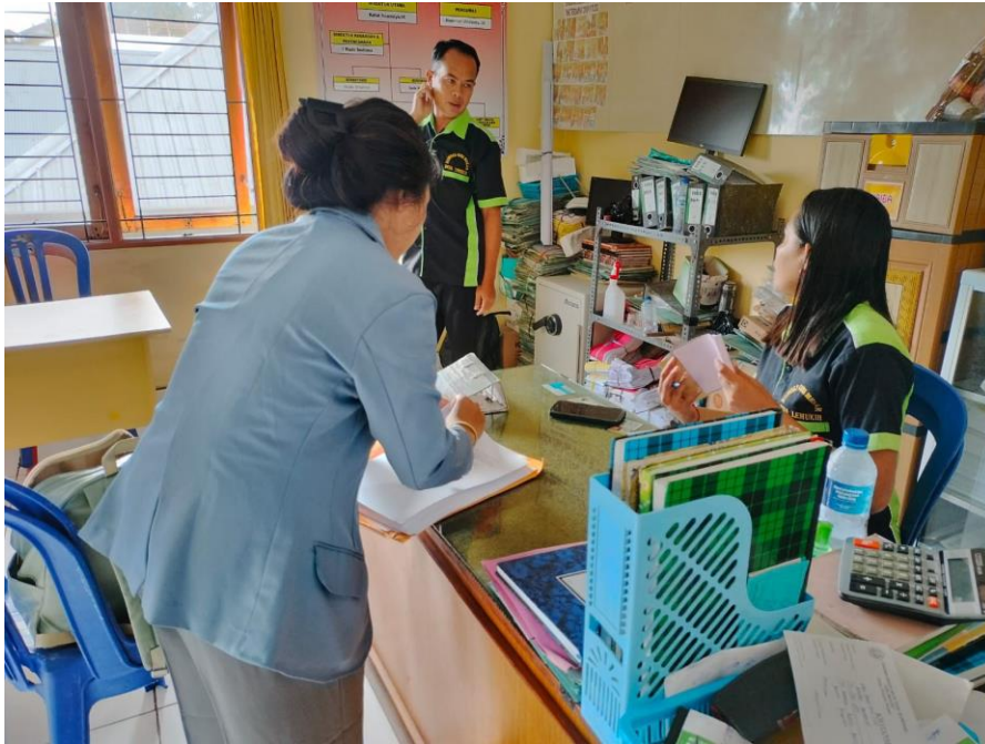
(BUMDes Desa Lemukih Giri Mekar)