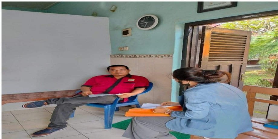
(BumDes Desa Sinabun Sari Guna Amertha)