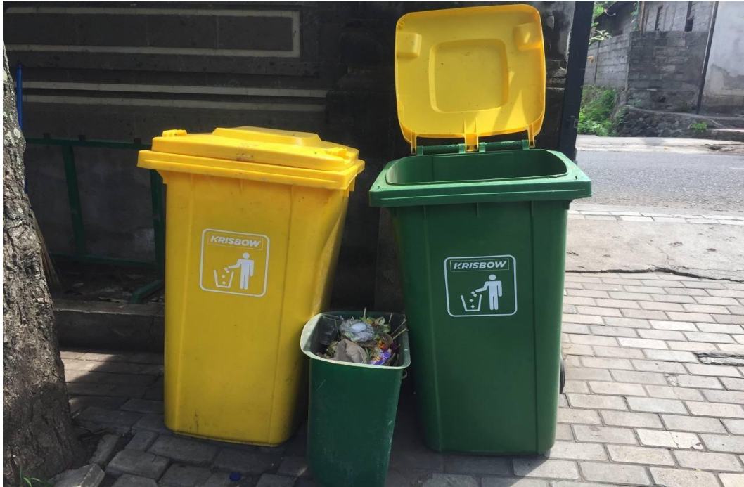
Tempat Sampah Non Medis