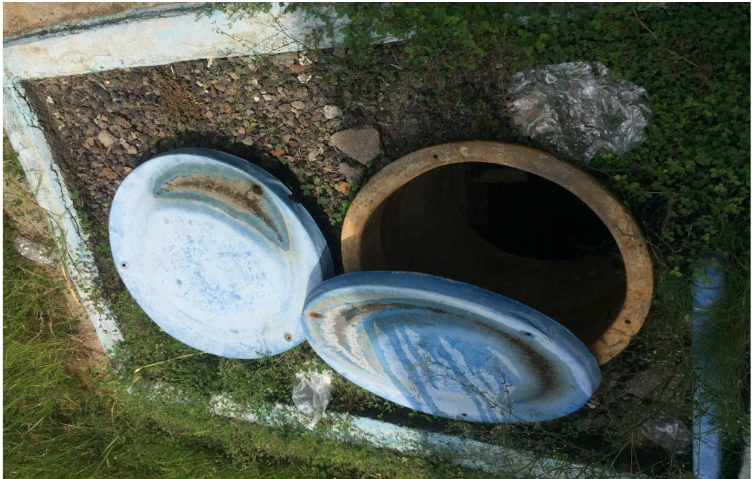
Septic Tank Mesin IPAL