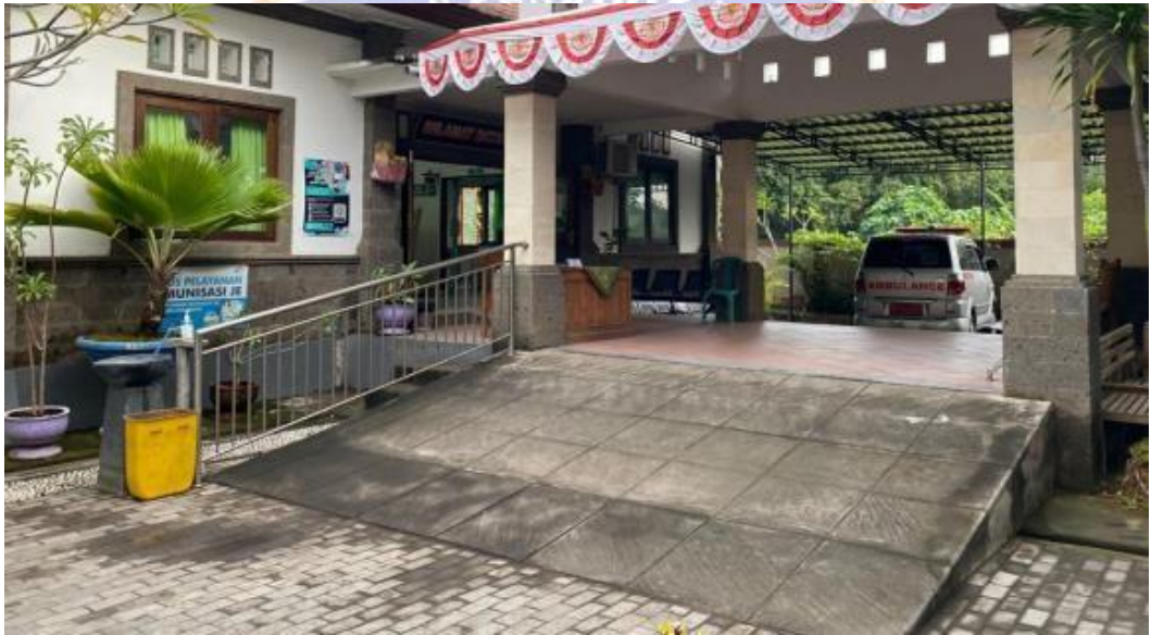
Tampak Depan Puskesmas Kubutambahan I