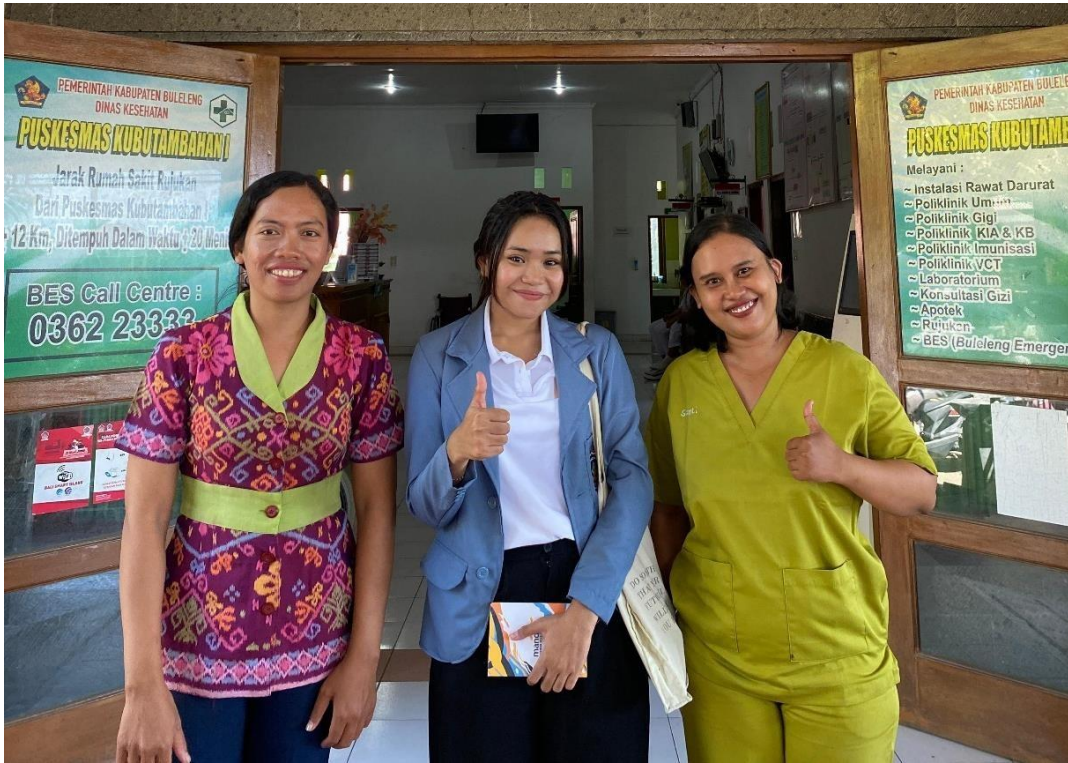
Wawancara bersama koordinator keuangan Puskesmas Kubutambahan I