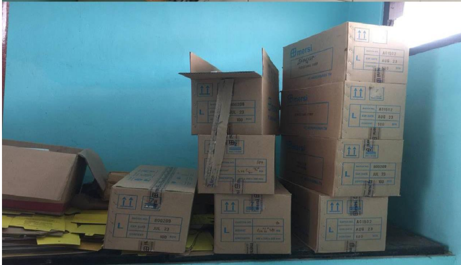
Tempat Penampungan Sementara (TPS) Limbah Padat Medis dan B3