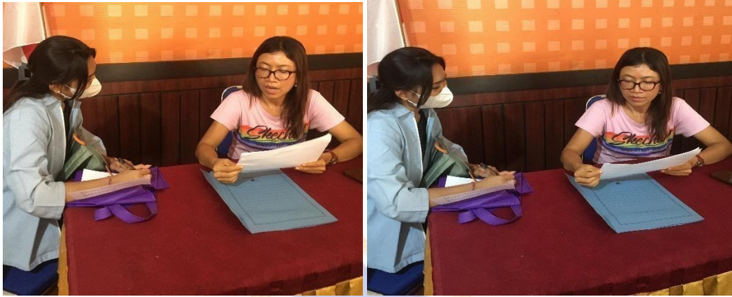
Kegiatan wawancara bersama Kepala Puskesmas Kubutambahan I