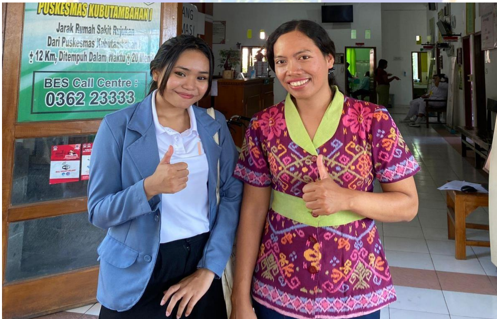
Wawancara bersama Bendahara JKN Puskesmas Kubutambahan I