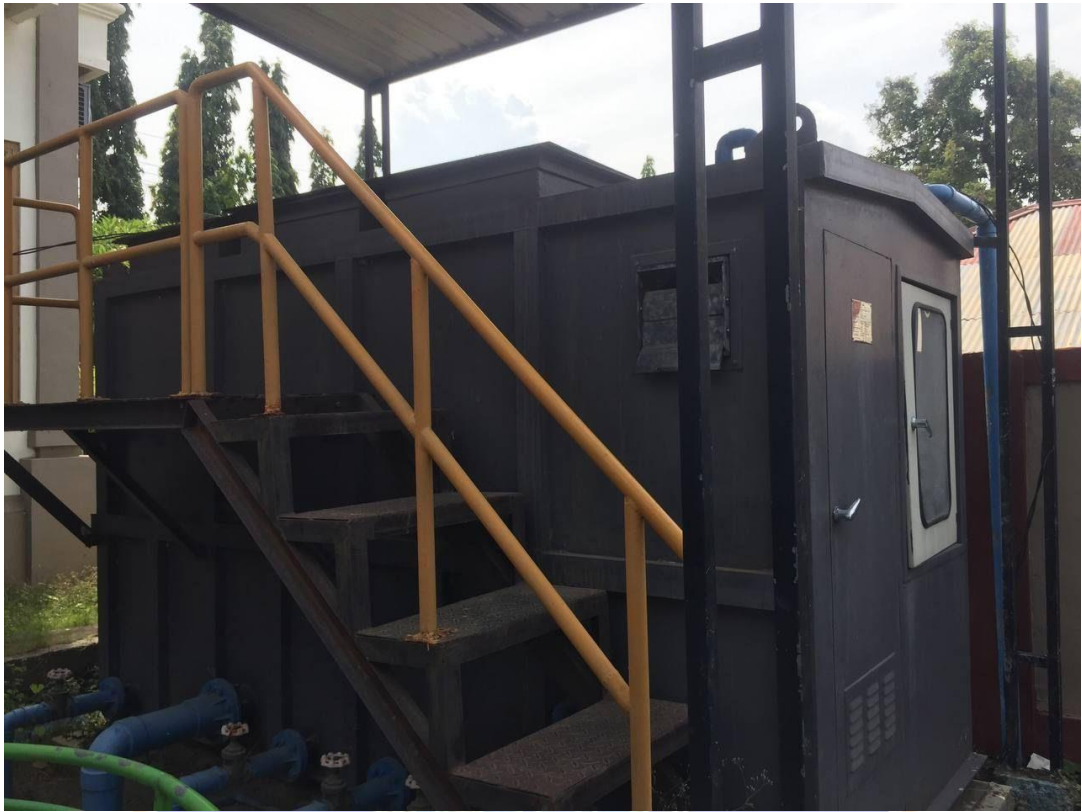
Mesin IPAL Puskesmas Kubutambahan I