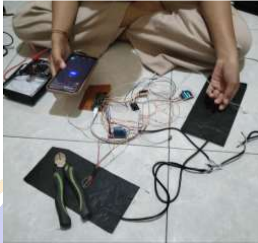
Lampiran 0 8 Elektronik Bra Tampak Depan

Lampiran 0 7 Dokumentasi Pengujian alat melalui Blynk sebelum di kemas